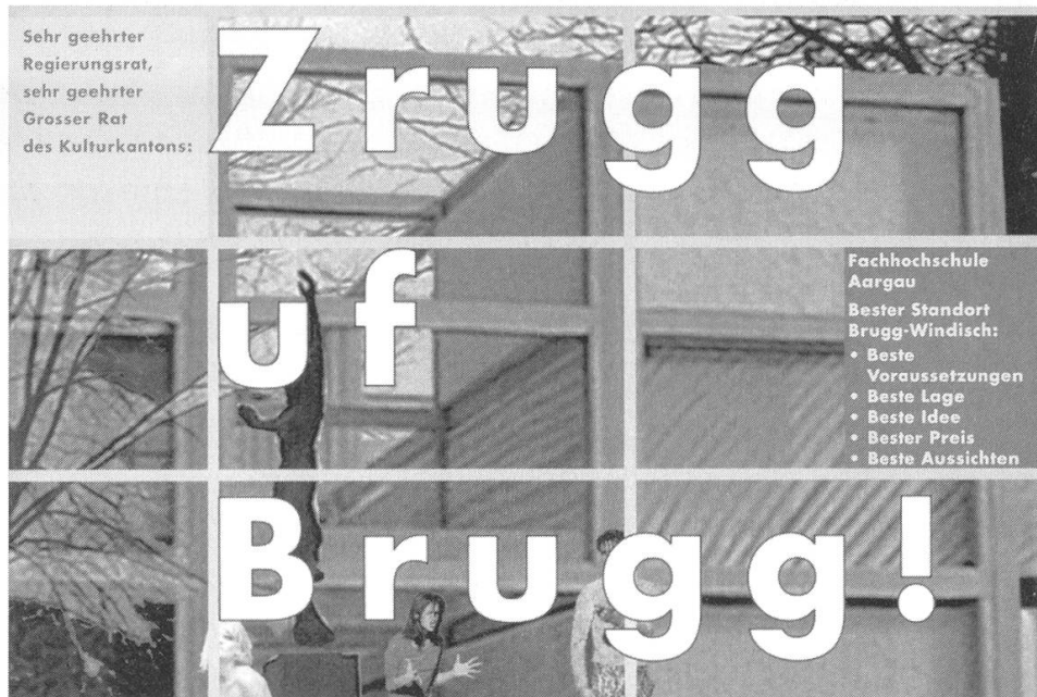
Als die Pläne des Regierungsrates bekannt wurden, die Fachhochschulen auf einen Doppelstandort Aarau-Olten zu konzentrieren, appellierte die IG Fachhochschule unter anderem mit einem Aufruf an Regierungsrat und Grossen Rat: «Zrugg uf Brugg!»