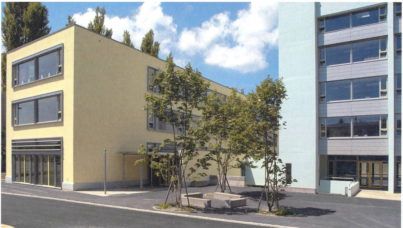
Blick von der Dohlenzelgstrasse. Rechts sanierter Altbau, links Erweiterungsbau.

Madeleine Schifferle / Barbara Stüssi-Lauterburg