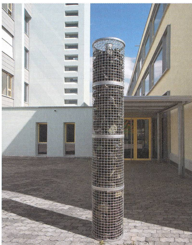
Drahtkorbsäule vor dem Altbau (links) und dem Erweiterungsbau (rechts).

Die unumgängliche Betonfassaden-Sanierung der Altbauten hat deren Erscheinung neu geprägt. Der markante Sichtbeton war in derart schlechtem Zustand, dass er nicht mehr gerettet werden konnte. Der notwendig gewordene Farb-anstrich der sanierten Betonflächen weist in seiner dezenten Differenziertheit zum Ergänzungsbau auf seine ältere Entstehungszeit hin.