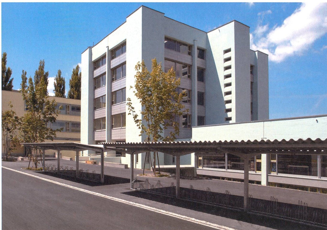
Blick von der Dohlenzelgstrasse.

Stockwerk mit weiteren vier Schulzimmern verzichtet. Die schliesslich geplanten Investitionen von 14,5 Millionen Franken lieferten noch politischen Zündstoff genug. Entsprechend hitzig wurden die Diskussionen in Parteien und Presse geführt, unter anderem unter Berufung auf andere Grossprojekte wie die Umfahrung. Intensive Überzeugungsarbeit in den politischen Gremien und in der Öffentlichkeit sowie die positiven Signale des Kantons in der Schulgeldfrage verhalfen dem Projekt schliesslich zum Durchbruch: im November 1997 im Einwohnerrat, im Juni 1998 in der Volksabstimmung.