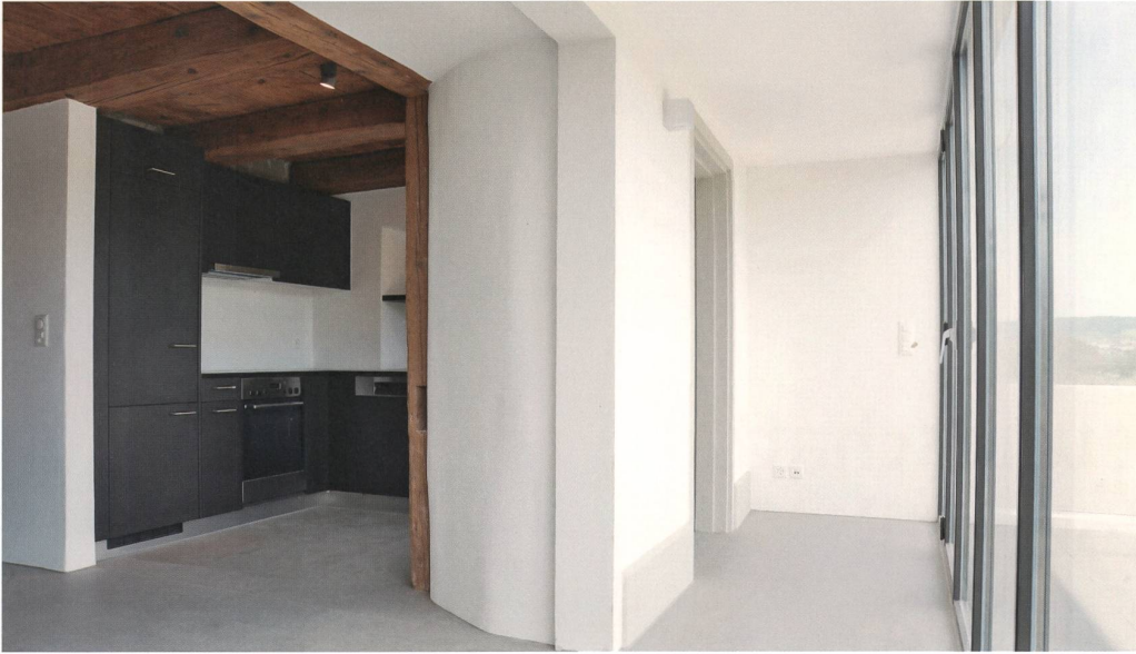
Die dicke Stadtmauer im Haus. Links der ursprüngliche Teil gegen die Hofstatt, rechts die Terrasse über dem Anbau aus dem 19. Jahrhundert gegen die Schulthess-Allee.

1864 traf der Stadtrat mit den Eigentümern der neun Häuser westlich des Salzhauses die folgende Vereinbarung: Der Vertrag sah vor, dass sämtliche neun Hausbesitzer am inneren Rand des bisherigen Stadtgrabens eine solide Mauer von 2,40 m Höhe erbauten. Die Fläche zwischen der alten Stadtmauer und der neuen Mauer, also die bisherige Berme, trat ihnen die Stadt unentgeltlich ab. Dadurch erhielten die Hausbesitzer die Möglichkeit, ihr Wohngebäude um etwa 3,30 m zu erweitern und zu überbauen. In der Folge entstand die heutige Ansicht dieses Altstadtrandes mit niedrigeren Anbauten, zum Teil mit Terrassen. Das Haus Nr. 23 gehörte damals seit zwei Jahren dem Obersten Friedrich Frey, ehemals Bezirksamtmann, Bezirksschulrat, Stadtmann sowie – seit 1841 – Grossrat. Oberst Frey errichtete vertragsgemäss die vereinbarte Mauer und überdachte sie wohl auch. Doch erst sein Neffe und Haupterbe, Emil Frey, Gärtner, errichtete 1884 den zweistöckigen Anbau. Auf sein Gesuch gestattete ihm der Stadtrat auch, der stadteigenen Fläche zwischen der neuen Hausfassade und der Strassenschale der Promenade ein «gefälligeres Aussehen» zu geben, vermutlich in Gestalt eines Blumenbeetes. 1898 friedigte er dieses, allerdings stadteigene Gärtchen mit einem Eisenzaun auf Sockeln ein. Der Stadt Brugg sicherte er urkundlich zu, er und seine Rechtsnachfolger würden nie ein Eigentumsrecht an diesem Boden beanspruchen. Und dabei blieb es bis heute!