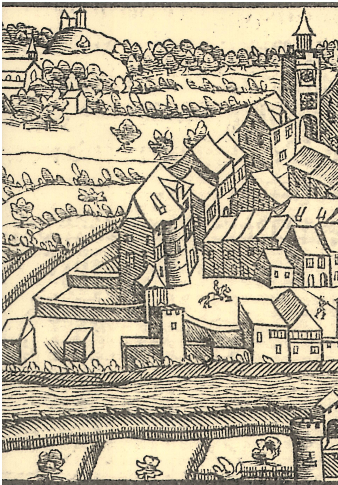
Blick auf den östlichen Teil der Brugger Altstadt kurz vor Mitte des 16. Jahrhunderts. Im Vordergrund das «Effingerschlössli» mit halbrundem Schneckenurm (heute steht hier das Salzhaus). Das niedrigere Haus dahinter ist der Vorgängerbau der Nrn. 21/23 der Oberen Hofstatt, das folgende, höhere die Nr. 19. Gut erkennbar ist der Eingang zum schmalen, 1732 dann jedoch überbauten Gässchen zwischen dem «Effingerschlössli» und dem Nachbarhaus Nr. 23. Holzschnitt, vermutlich von Hans Asper, publiziert in Stumpfs Eidgenössischer Chronik, Zürich 1548.