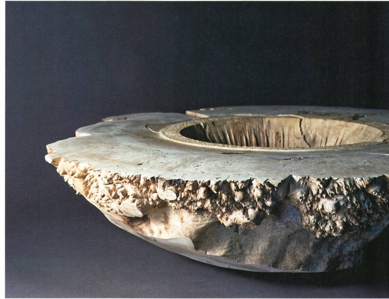
Gefäss aus einem Rosskastanien-Kropf

bis zum Weiss des Bildhintergrundes bewegt sich die Farbigkeit.