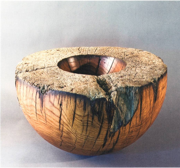
Gefäss alter Spaltstock aus Eichenholz