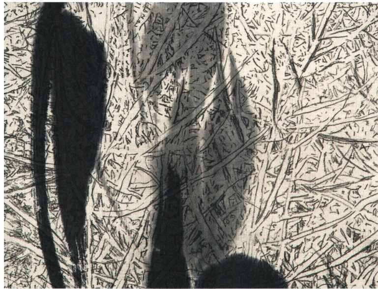
«Raps» Vernis mou mit Tuschmalerei