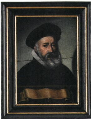
Stephan Fabricius (1569–1648)