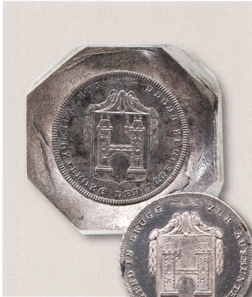
Ein Beispiel für jahrhundertelange Traditionslinien: Früher belohnte die Stadt fleissige Schüler mit einem extra geprägten Schulbatzen – vermutlich eine Wurzel für den heute noch üblichen Jugendfestbatzen.