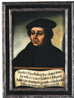
Martin Luther (1483–1546)