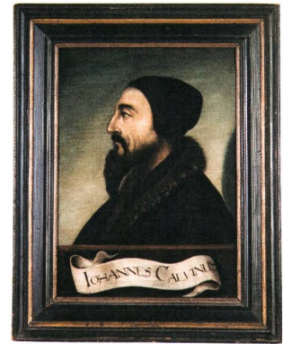
Jean Calvin (1509–1564)