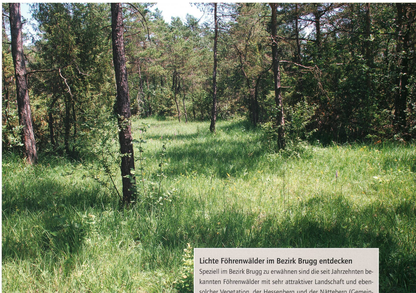
Lichter Föhrenwald mit Gras