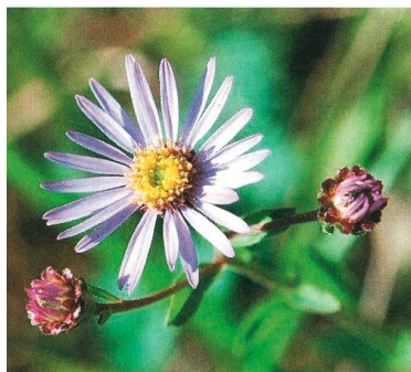
Bienenragwurz, Kleiner Eisvogel, Bergaster

Der Ursprung für diesen Föhrenwaldreichtum liegt im früheren Abtrag von Mergelböden im Aargauer Jura. Bis in die erste Hälfte des 20. Jahrhunderts