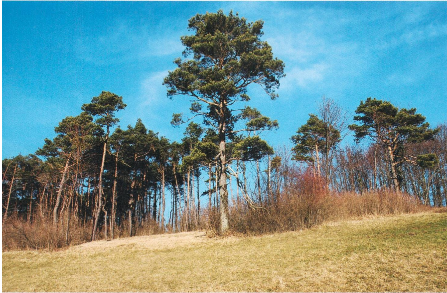
Lichter Föhrenwald im Winter

Baumstämme nicht wieder ausschlagen, werden sie danach regelmässig bodennah abgesägt. Jährliches Mähen erhält und fördert die wiesenartige Vegetation mit den besonderen, teils seltenen Pflanzenarten. Alternativ können die Standorte auch mit Ziegen oder Rindern beweidet werden. Für eine Waldweide braucht es jedoch eine Bewilligung der Abteilung Wald des Kantons Aargau. Dort, wo bereits eine mehr oder weniger dichte Strauchschicht besteht und das Mähen nicht möglich ist, wird die Gebüschvegetation erhalten und gefördert. Diese bildet einen idealen Übergangsbereich zum geschlossenen Wald.