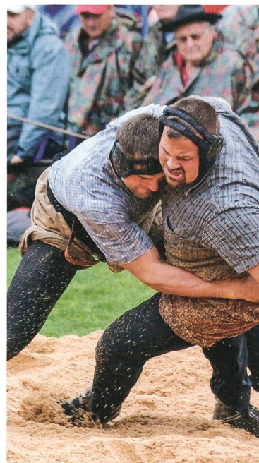
In Effingen findet der 18. Fricktaler Abendschwinget statt

Brugg | Siegbert Jäckle nimmt die Arbeit als Gesamtschulleiter der Schule Brugg auf. – Das renovierte Stapferschulhaus wird von den Primarschülern mit neuem «Stapferlied» und eigens kreierter Schokolade wieder bezogen. – Nach Protesten gegen einen Abbruch sisiert der Stadtrat den «vorzeitigen Rückbau» des Kupperhauses, bis der Terminplan für den Neubau der Zentralen Verwaltung vorliegt. Bis dahin steht das Gebäude für kulturelle Anlässe und Nutzungen mit öffentlichem Charakter zur Verfügung. – Auf dem WC in der Bahnhofunterführung wird ein Toter aufgefunden. – Unter dem Motto «Schätze aus Vindonissa – werde Archäologe» eröffnet das Vindonissa-