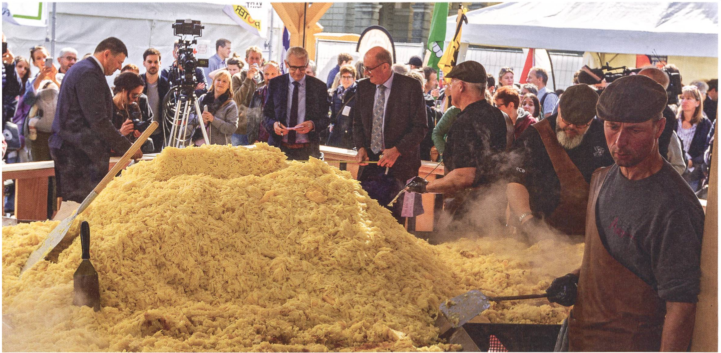
Weltrekord-Rösti vor dem Bundeshaus im Herbst 2022 auf einer 13 Quadratmeter grossen Herdplatte zum 125-Jahr-Jubiläum des Verbands