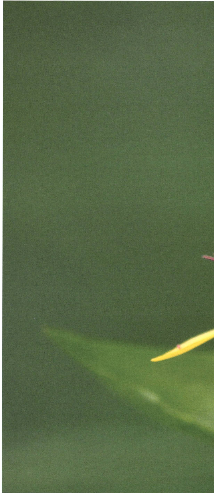
Gelber Enzian