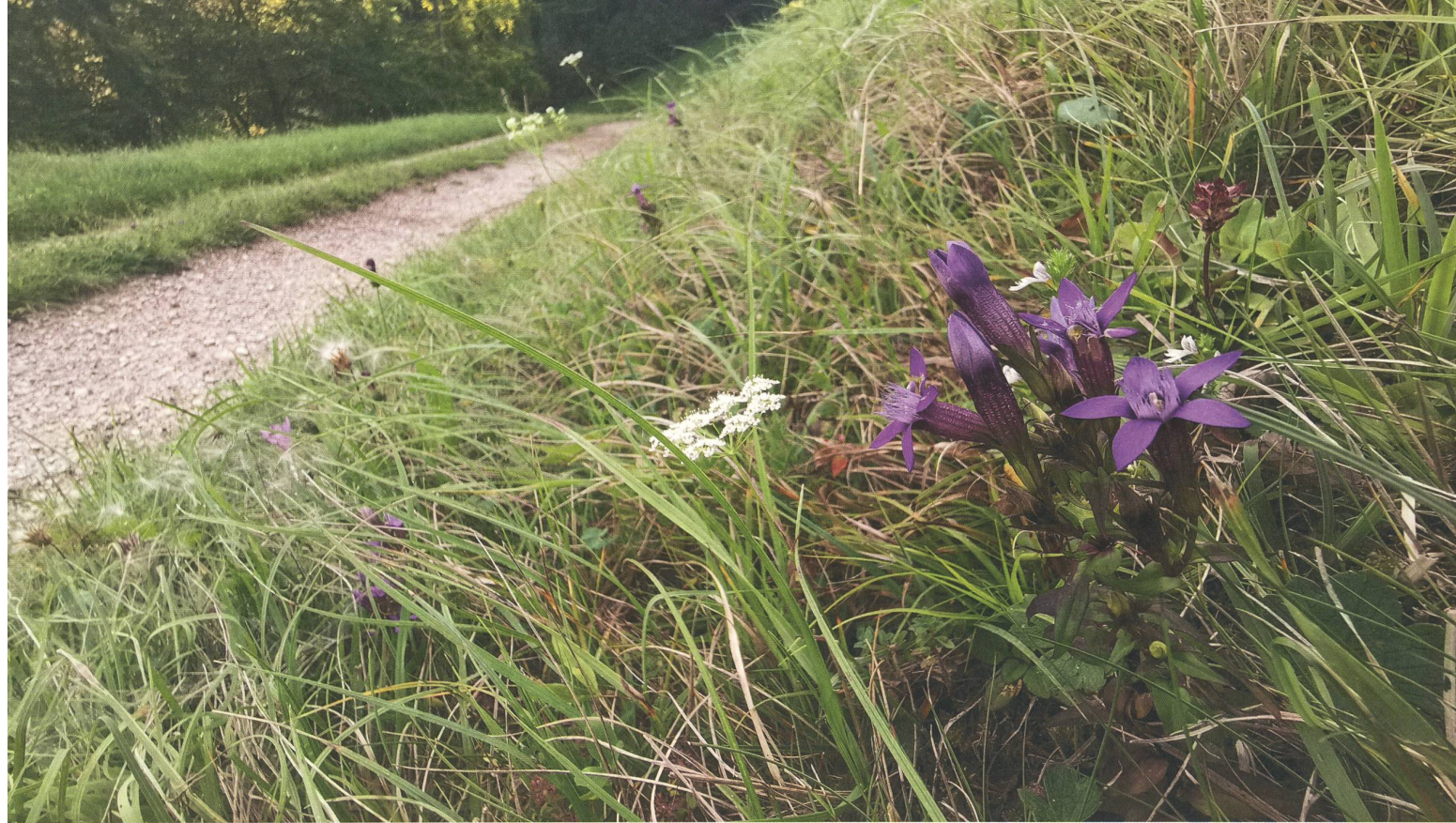
Die sensiblen Enziane sind hervorragende Anzeiger für gesunde, artenreiche Lebensräume. Die Deutschen Enziane in der Raimatt in Mönthal sind vom Feldweg gut sichtbar