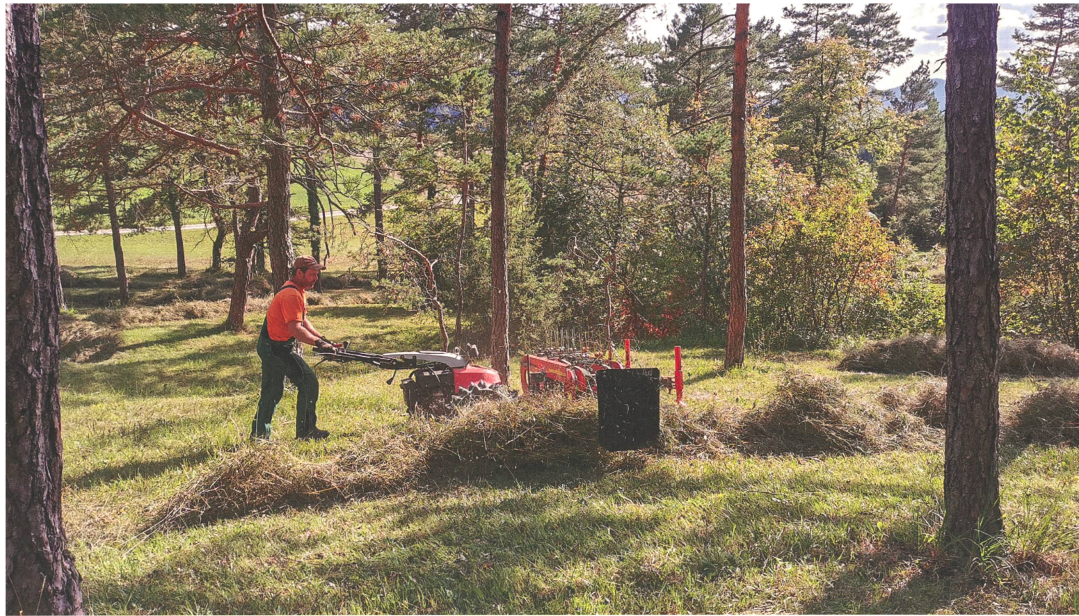
Rolf Treier bei Mäharbeiten im lichten Föhrenwald: Das Schnittgut wird abgeführt, damit möglichst wenige Nährstoffe vor Ort bleiben