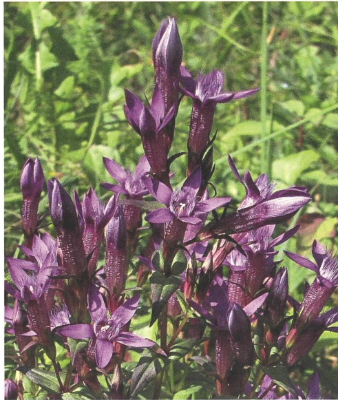
Die vier Enzianarten des Jurapark Aargau im Überblick:

Der Deutsche Enzian kann pro Exemplar eine bis viele Blüten besitzen: Jede violette schlanke Trichterblüte besitzt einen bärtigen Schlund