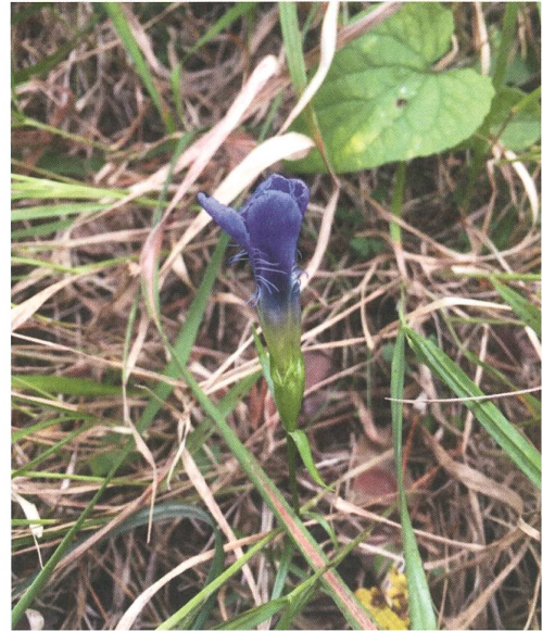
Die langen Fransen an der Basis der hellblauen Kronzipfel sind für den Gefransten Enzian namensgebend (Bild: Jurapark Aargau)

Der Deutsche Enzian kann pro Exemplar eine bis viele Blüten besitzen: Jede violette schlanke Trichterblüte besitzt einen bärtigen Schlund (Bild: Jurapark Aargau)