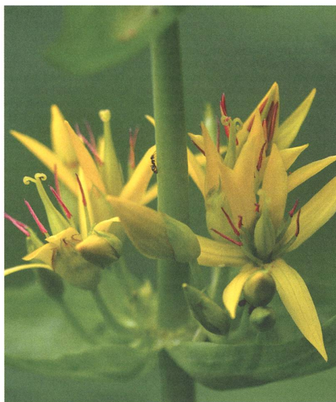
Die Blüten des Gelben Enzians sind tief geteilt: Die fünf bis sechs schmalen lanzettlichen Kronzipfel sind nur am Grund verwachsen