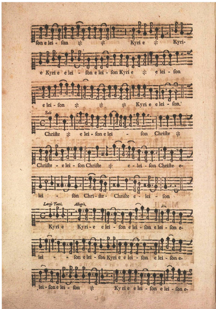
Faksimile der Noten von 1709: Sopranstimme (Kyrie) aus «Missa Due»

übergab, weckte beim Brugger Kirchenmusiker zuerst das Interesse und dann die Begeisterung für die Musik von Giovanni Battista Bassani. Auf der Suche nach den Originalen wurde er rasch fündig: Vollständige Exemplare der 300 Jahre alten Sammlung von Messen finden sich in der Universitätsbibliothek von Warschau, in der Zentralbibliothek Zürich und in der Bayrischen Staatsbibliothek, welche die Noten auch als Faksimile im Internet zugänglich gemacht hat.