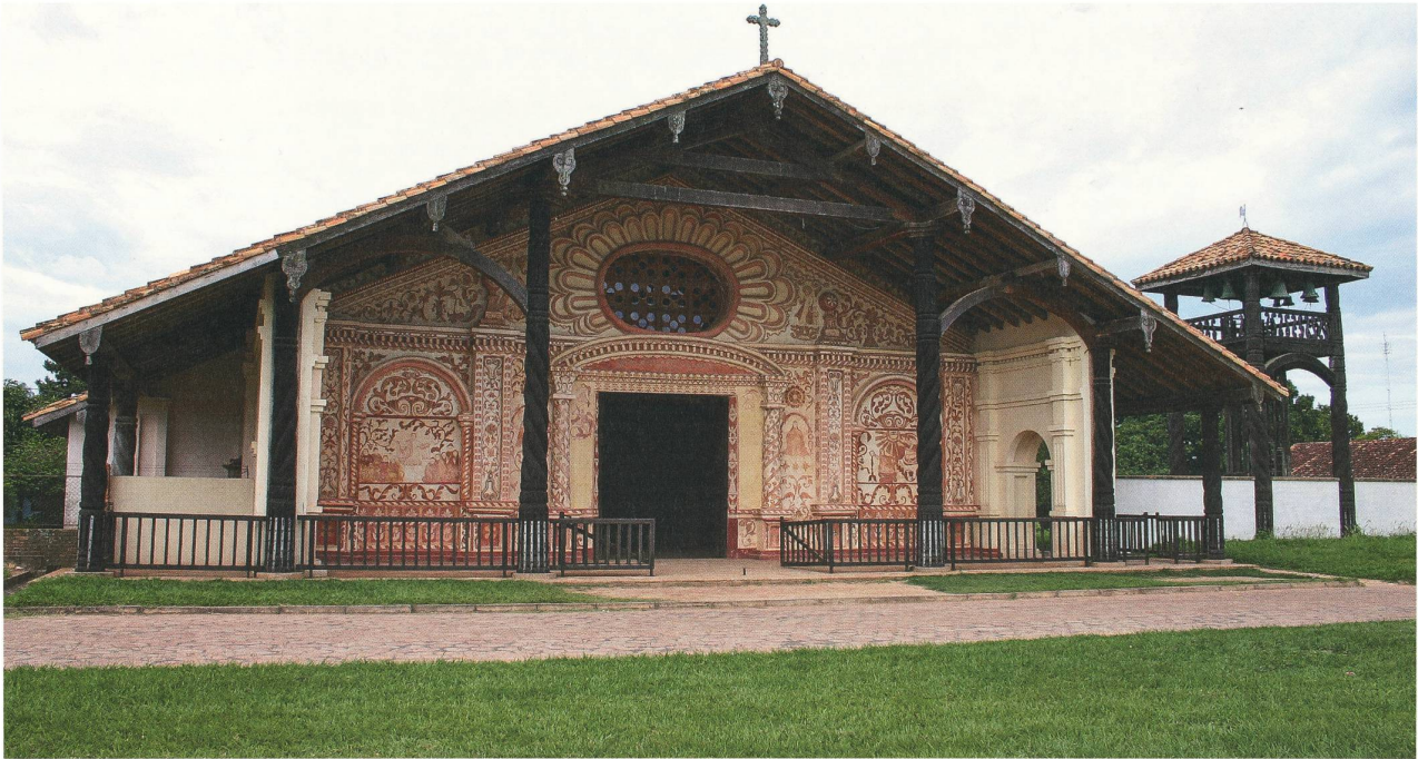
Restaurierte Kirche der Jesuitenmissionare von San Rafael de Velasco in Bolivien: Hier wurden nach 1970 die Noten von stark bearbeiteten Versionen der Messen von Giovanni Battista Bassani gefunden