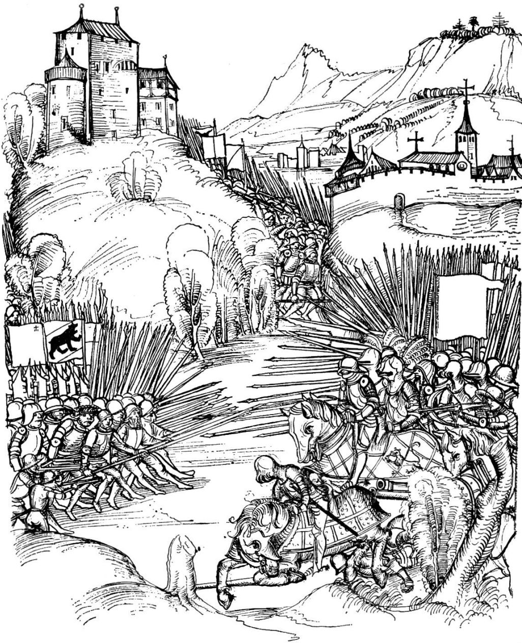
Die Schlacht bei Grandson, 1476 — (Aarauer Band, fol. 176 r)

durch einen deutschen Doktoranden, der sich bei ihm über den Bremgarter Band Auskunft holte, ganz zufällig davon Kenntnis, dass sich der vermisste Band in der Stadt Ueberlingen am Bodensee befindet. Auf welchen Wegen er dorthin geriet, ist noch unbekannt. Fest steht nur, dass er mit den übrigen Be-