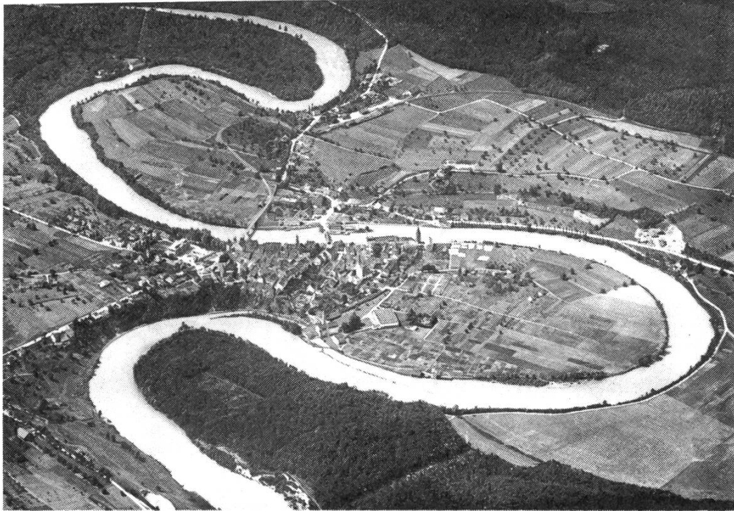
Abb. 1: Bremgarten vor 1920. Die Stadt und ihre Aussenquartiere werden von landwirtschaftlichen Flächen umschlossen.

stehen wir mitten in einem totalen Umbruch der heimatlichen Landschaft. Die menschliche Siedlungstätigkeit füllt nach und nach die vorhandenen Talräume von Waldrand zu Waldrand auf. Am Beispiel des Gemeindebannes Bremgarten lässt sich diese Entwicklung gut aufzeigen. Betrachten Sie einmal das Flugbild (Abb. 1), das vor 1920 von einem Pionier der schweizerischen Luftfahrt aufgenommen wurde. Es zeigt die Altstadt mit ihren Erweiterungen beim Schulhaus, beim Waagplatz und im Westgebiet, umgeben von Feldern, Äckern und Baumgärten.