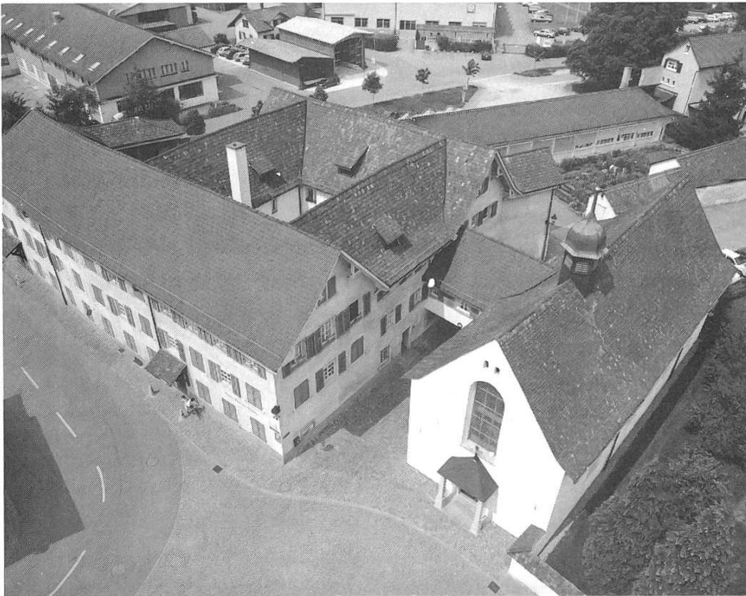
Der nordwestliche Klostertrakt lehnt sich an die Stadtmauer und bildete mit den anderen drei Klosterflügeln einen quadratischen Innenhof. Hinter diesem Geviert erblickt man Dach und Dachreiter (Glockentürmchen) der Klosterkirche. Der Haupttrakt des Klosters ist entlang der Strasse gebaut, die vom Au-Tor zur Pfarrkirche führt

Die Klosteranlage entsprach der damaligen und bis in die neuere Zeit traditionell gebliebenen Bauweise der franziskanischen Klöster. Der nordwestliche Klostertrakt lehnte sich hier an die Stadtmauer an und bildete dann mit den anderen drei Klosterflügeln einen quadratischen Innenhof. Der Haupttrakt war entlang der Strasse gebaut, die vom Au-Tor her zur Pfarrkirche führte.