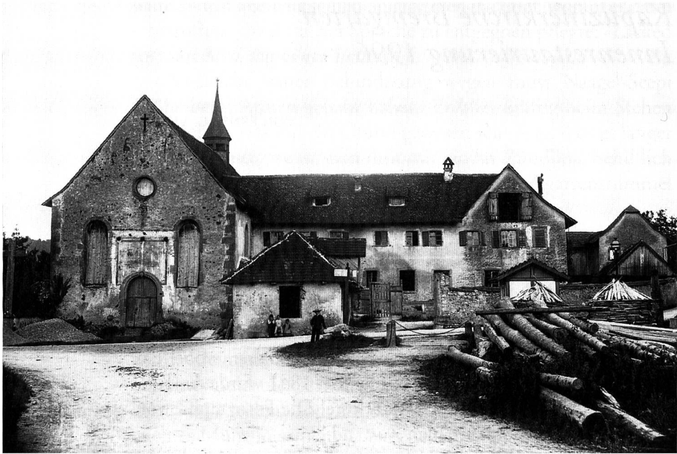
Das Kapuzinerkloster mit der Kirche links im Bild vor der Renovation 1889.