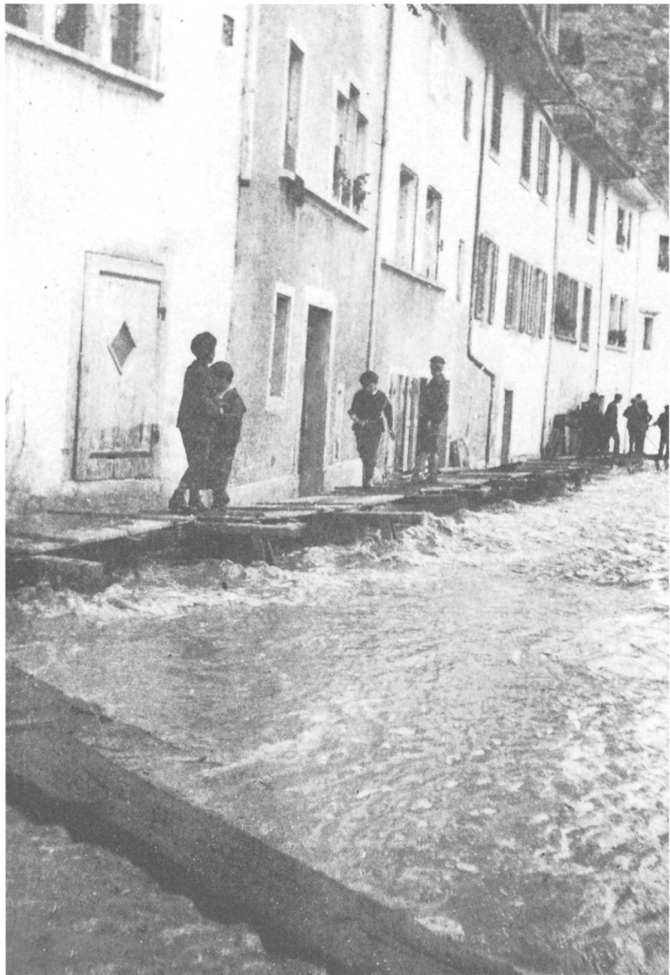
Die untere Reussgasse 1910 mit dem erstellten Notsteg.

Weiter berichtet er detailliert: «Es war denn die Reuss in schneller Zunahme begriffen und hatte Dienstag abend bereits den gewöhnlichen Hochwasserstand erreicht. Die über Nacht offenen Wolkenschleusen liessen sie noch weiter wachsen und hoben sie vollends über ihre Grenzen. Morgens 7 Uhr war sie schon in die Reussgasse von Bremgarten eingedrungen, die Anwohner begannen sich durch Verstopfen der Haus- und Kellertüren des nassen Elementes zu erwehren, das indes unaufhaltsam stieg. Abends 4 Uhr war die Reussgasse eine reissende Wasserstrasse