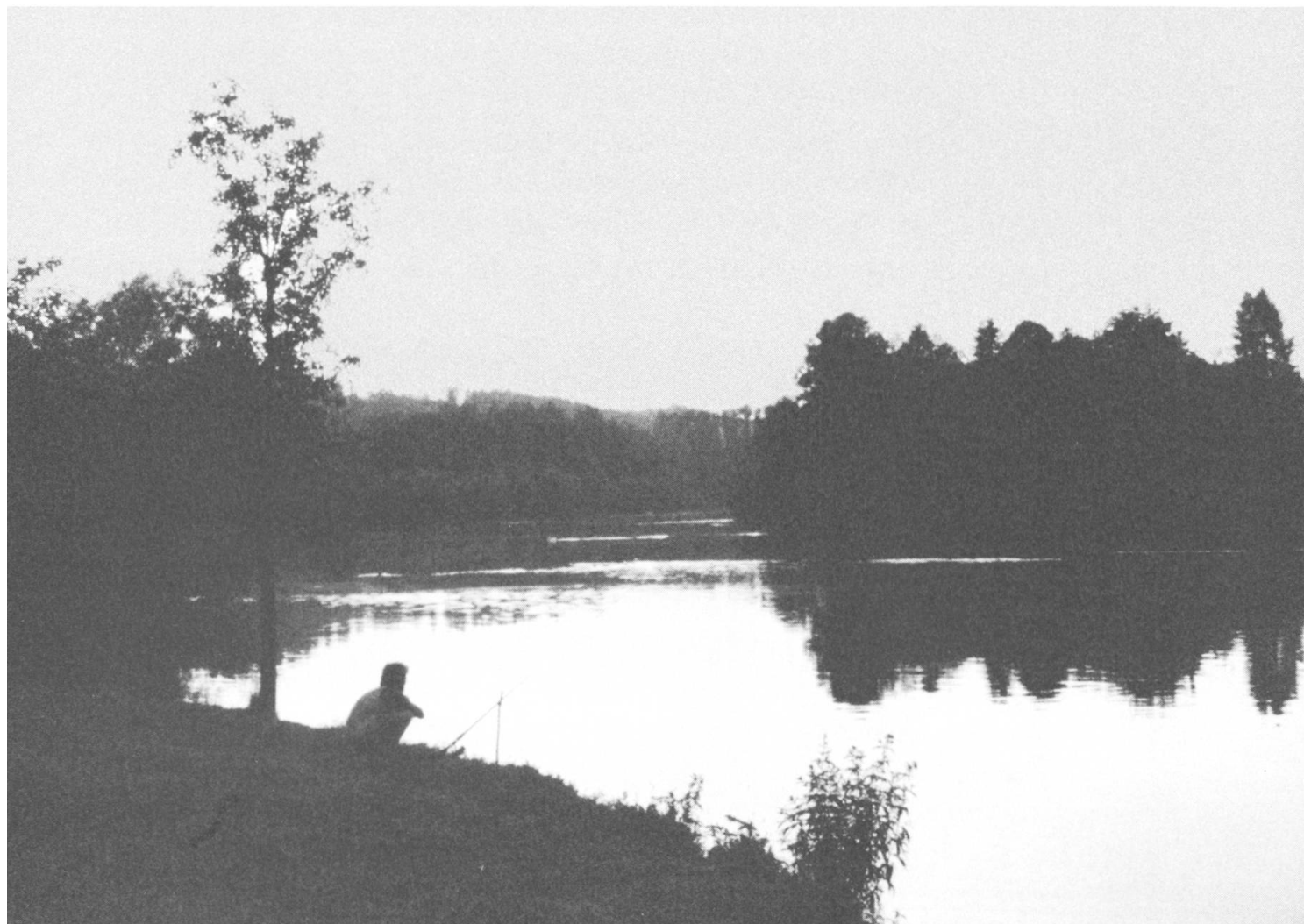
Stimmungsaufnahme am Flachsee vom ehemaligen Standort des alten AEW-Kraftwerkes aus.