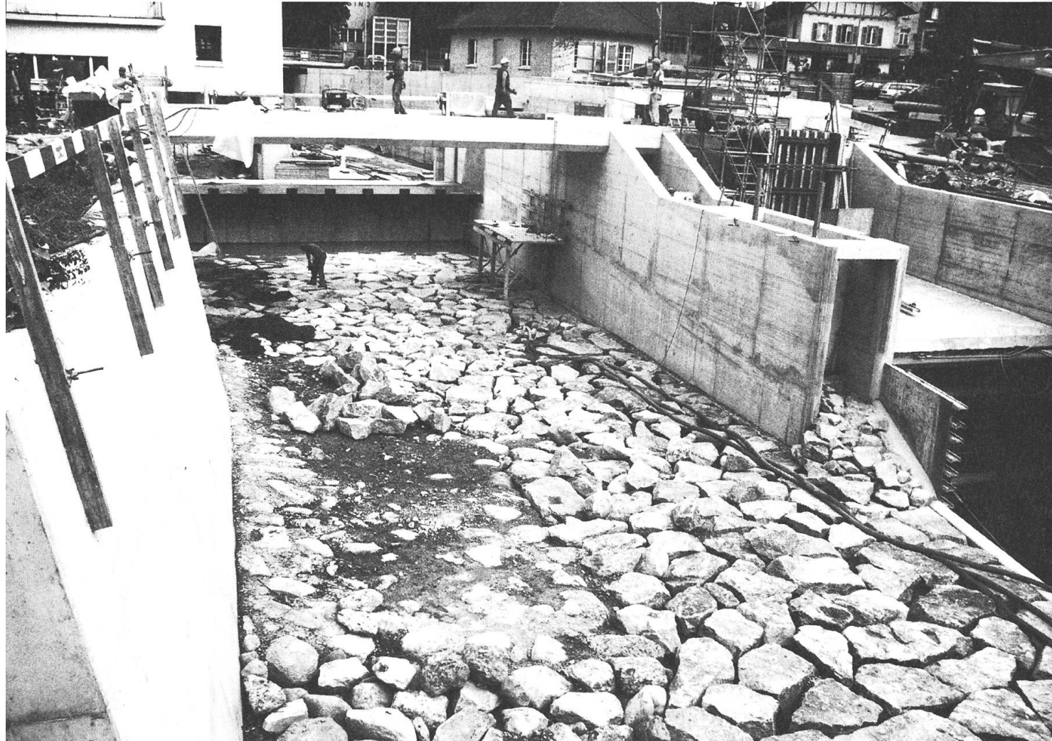
Der mit Blockwurf ausgelegte Kanal unterhalb der Wehrklappe; rechts im Bild die Öffnung zum Fischpass.

nenhaus abubrechen. Die mechanisch-elektrischen Einrichtungen baute sie aus und deponierte die Teile auf der Insel und in der Garage beim Hauptgebäude; ebenso wurden das Wehr und die Rechenanlage der linken Turbine demontiert. Die Rampe zur Baugrube kam an den ehemaligen Standort der Sägeturbine zu liegen. Die alten Kanalmauern verschwanden, und man baggerte die Baugrube aus. Trotz Spundwänden begannen sich die Ufermauer und das angrenzende Terrain zu senken, was den Einbau eines Spriesskranzes zur notwendigen Stabilisation nach sich zog.