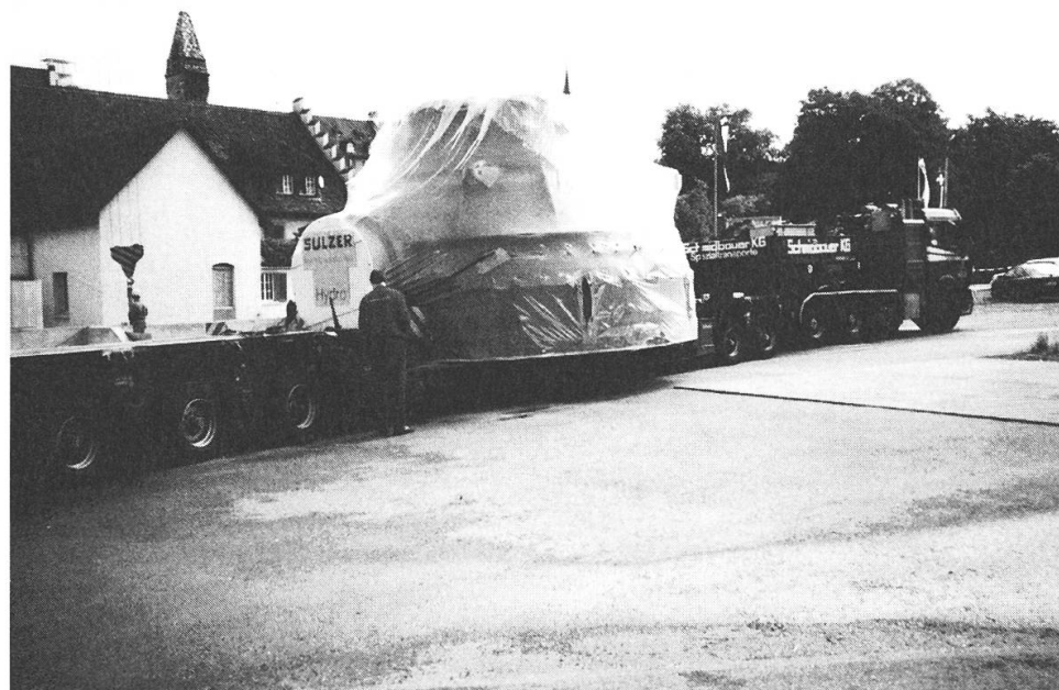
Der Leitapparat mit Einlaufrohr aus Ravensburg (D) erreicht am 16.10.98 sein Ziel.

Anfangs August konnte mit der Montage des von der Firma Bartholdi, Koblenz, gelieferten Generators begonnen werden, den man auf das Winkelgetriebe der Rohrturbine montierte. Auch die Steuerschranke der Firma Kobel, Affoltern i.E., wurde im Kraftwerk aufgestellt und angeschlossen.