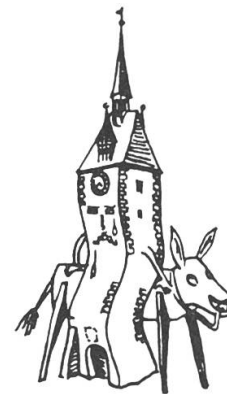
De Brämgarter Spitelturn und de Esel, das heute noch gültige Signet der Spitelturnclique.

Die Fastnacht 1973 begann wieder mit dem Manifest, verlesen am Schmutzigen Donnerstag. 48 Gruppen boten am Sonntag