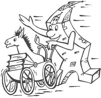
Das zum Anlass der Chaisewagen- rennen geschaffene Emblem.

9) Kunststoff- Fabrikant und grosser Gönner der Clique 10) Transport- Unternehmer