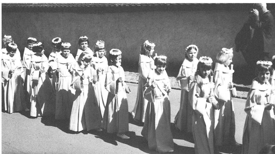
Die erste Generation der schlichten, einheitlichen Erstkommunion-Kleider. (im Bild die Jugend des Jahrgangs 1959).

Bereits im Jahr 1966 bestellt der Mütterverein für die Erstkommunion-Kinder hübsche, einheitliche Kleider, und am Weissen Sonntag 1967 präsentieren sich die Kinder erstmals stolz im neuen Tenue.