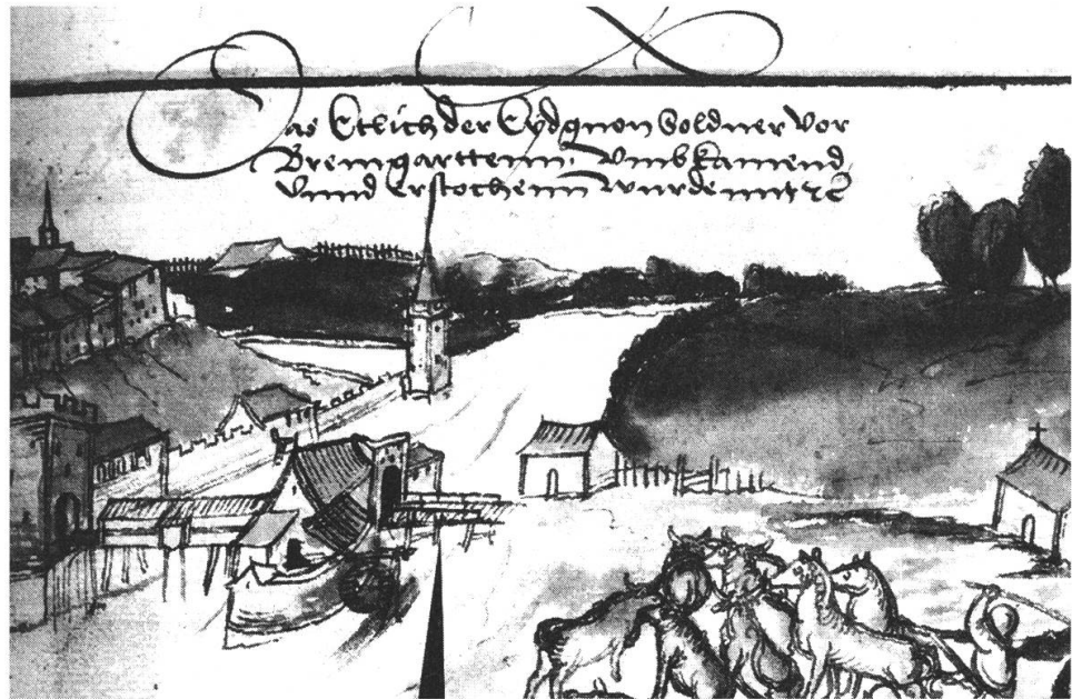
Abb.1: Die Reussbrücke, 1514 von Wernher Schodoler gezeichnet. Die damals bereits teilweise gedeckte Holzbrücke steht auf Eichenpfählen, die linksufrige Vorbrücke liegt auf zwei Brückenjochen.

Bei Bremgarten entstand im Mittelalter ein wichtiger Reussübergang. Unterhalb des heutigen Hexenturms wurde wahrscheinlich im frühen Hochmittelalter, im Zug der Besiedlung der Reussniederung beim Dorf Bremgarten, eine Fähre eingerichtet, um auch bei höherem Wasserstand mit Hab und Gut die Reuss gefahrlos zu überqueren. Diese war auch nach dem Brückenschlag im Notfall noch benutzbar.