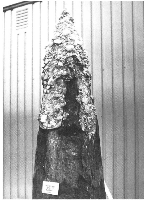
Abb. 6 und 7: Aus der gleichen Zeit wie die Reussbrücke von Bremgarten stammt auch die mittelalterliche Rheinbrücke von Zurzach , die 1269 – 1275 erbaut worden ist. Da sich die mit Pfahlschuhen beschlagenen Eichenpfähle gleichen und ähnliche Masse haben, ist es möglich, dass die gleichen Baumeister und Schmied die Brücken von Bremgarten und Zurzach gebaut haben.

linkes Bild: Eichenpfahl Nr. 11599 von Bremgarten.