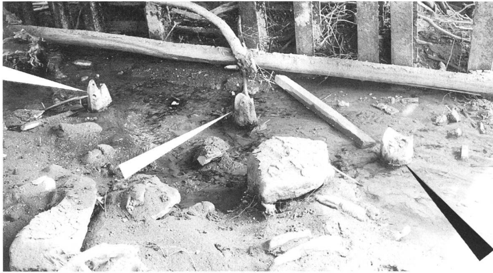
Abb. 4: Die geborgenen Eichenpfähle auf dem Baugelände, Juni 1998.