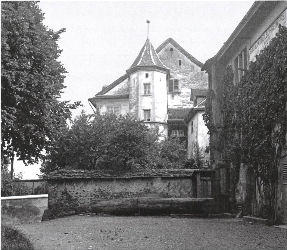
Das Schellenhaus mit Kegelplatz um 1940. An der Ecke das angehängte Plumpsklo. Hinter dem Tor rechts war das Feuerwehrmagazin. Vor dem zweiten Stockwerk hängt die Tafel der Schreinerei Wolf.

man den armen Leuten nicht als Existenzminimum gelassen hat. Es standen Stühle, Tische und Kästen herum.