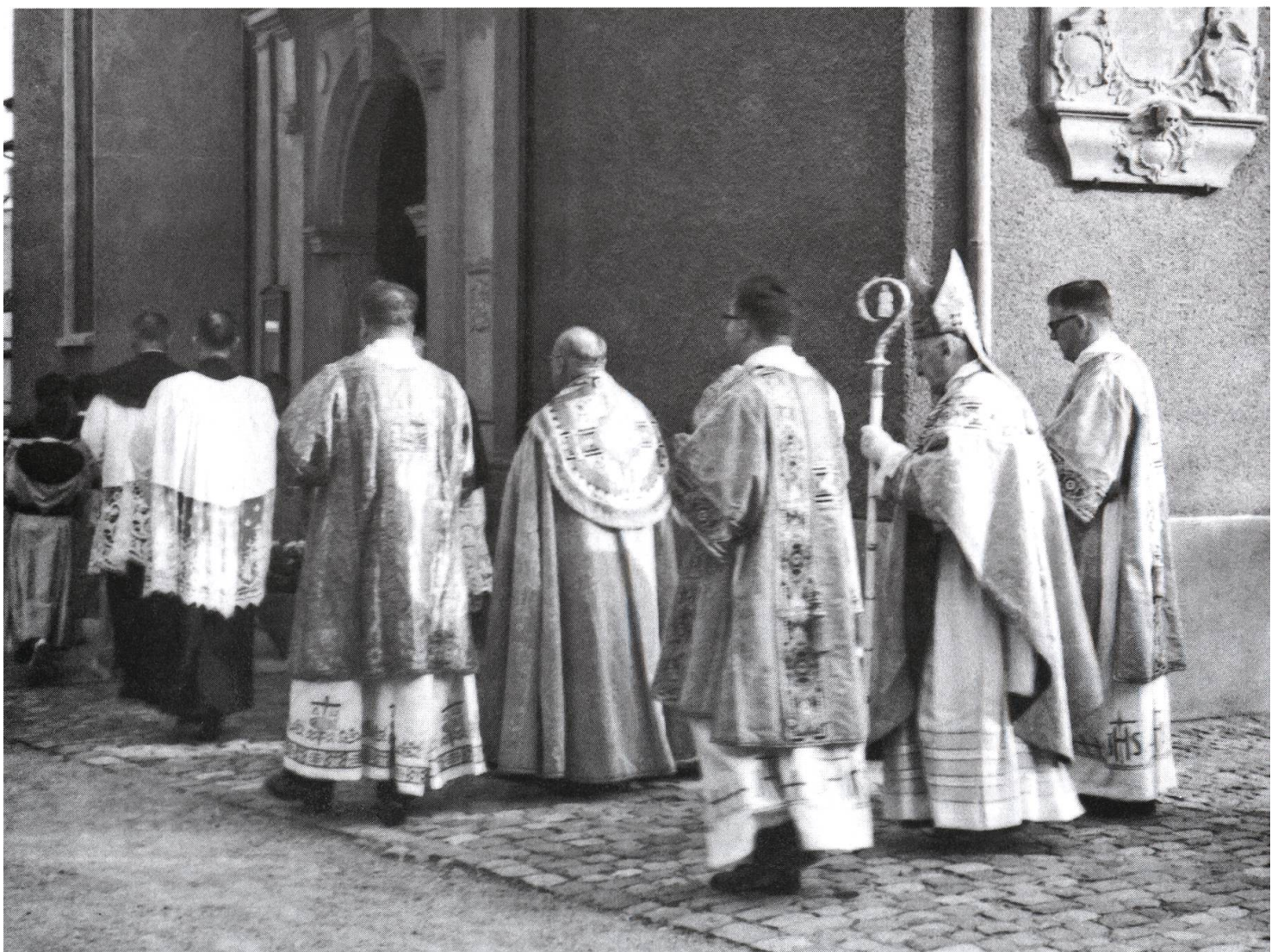
Sonntagmorgen: Der Bischof mit Gefolge beim Einzug in die Stadtkirche.