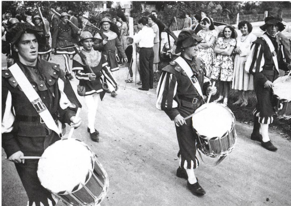
Eindrücke vom Festumzug