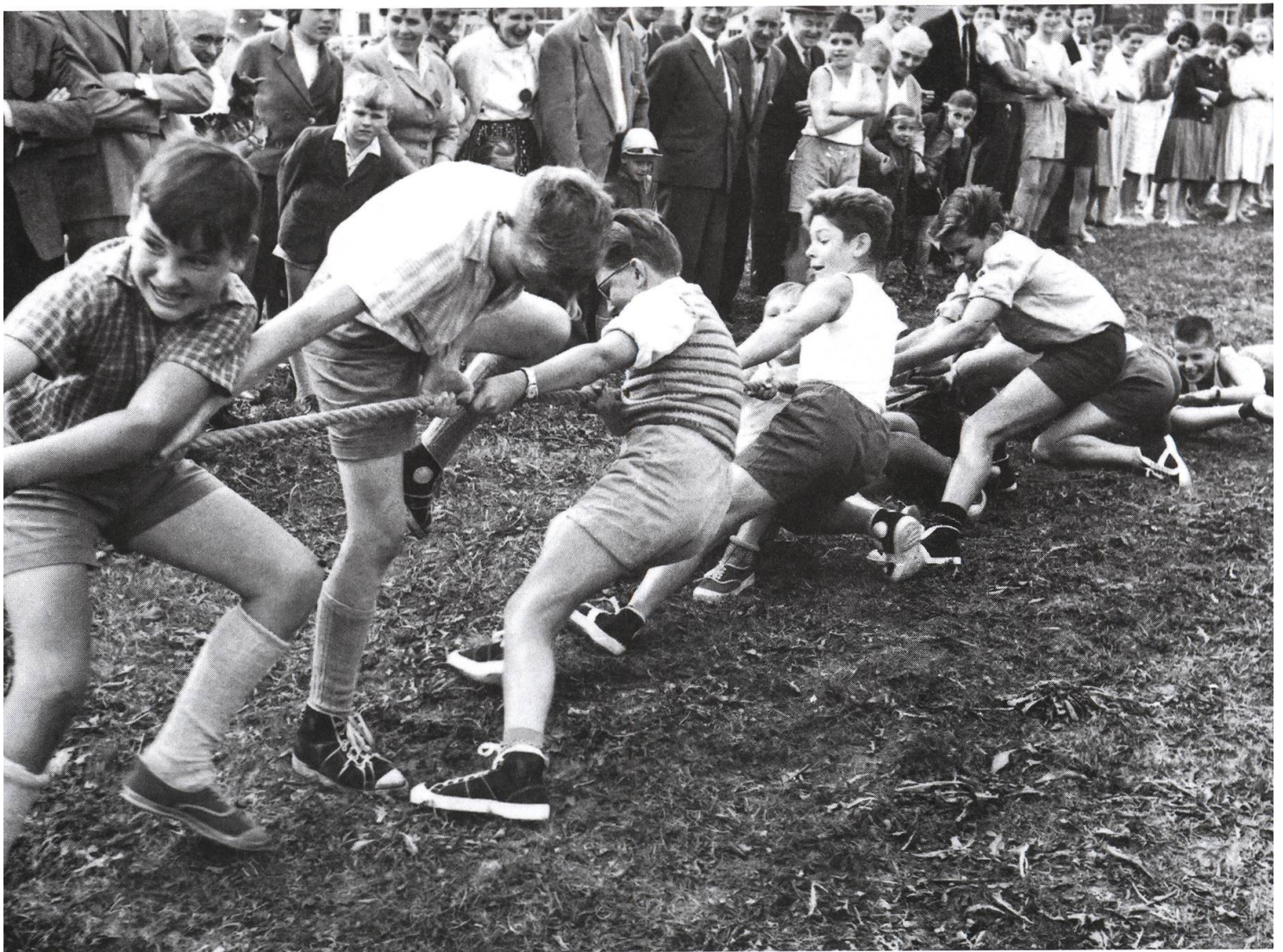
Seilziehen am Sportnachmittag.