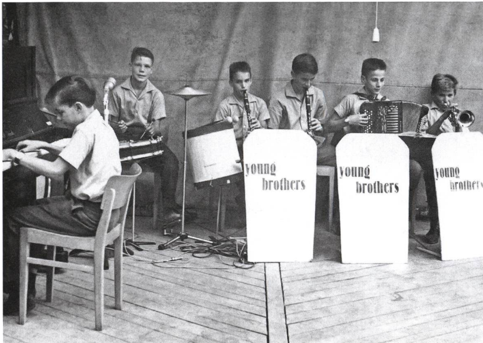
Die young brothers beim Konzert.