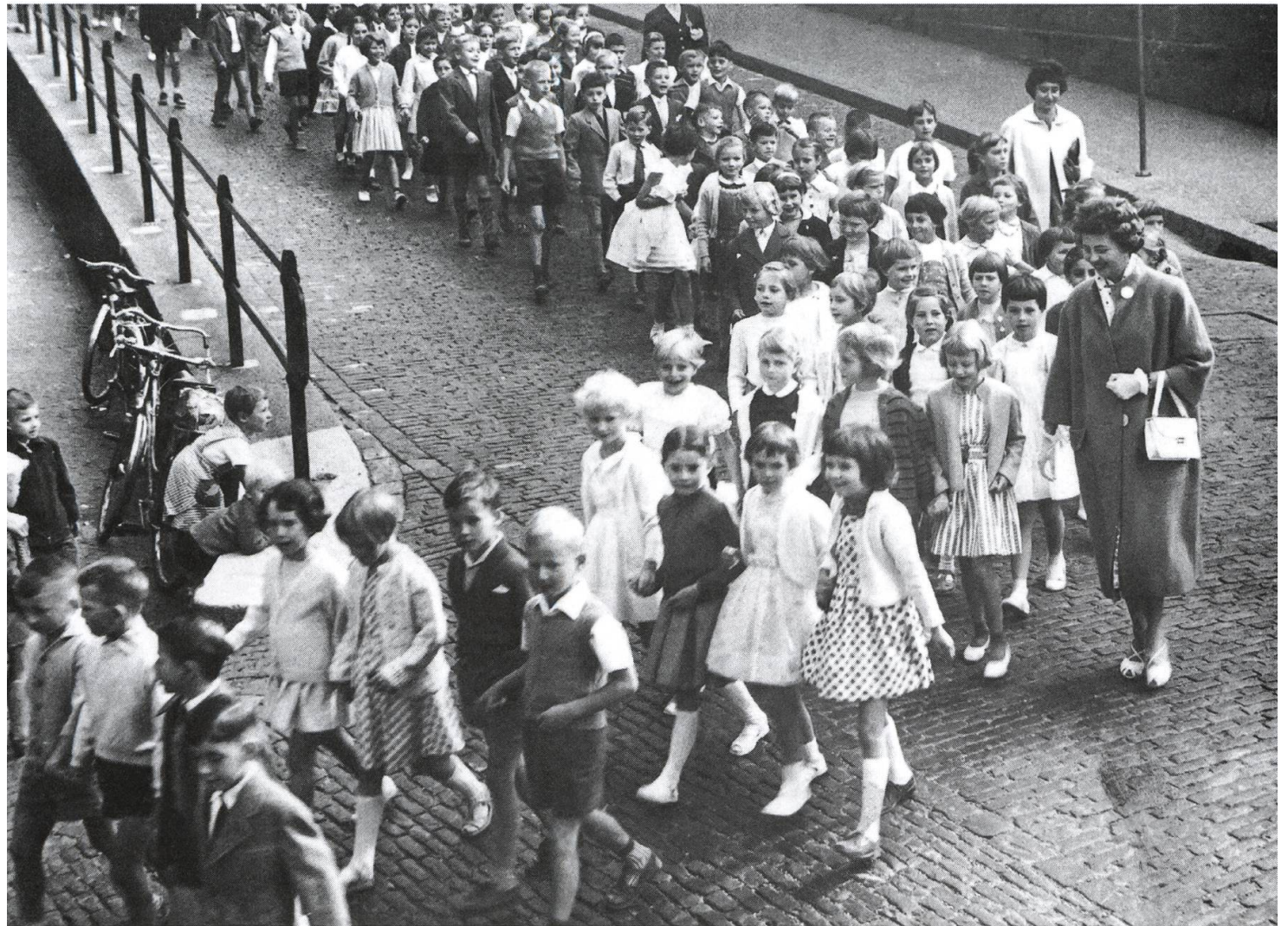
Auftakt zum Jugendfest. Die Schuljugend zieht vom Schul- hausplatz über Marktgasse und Bogen zur Stadtkirche.