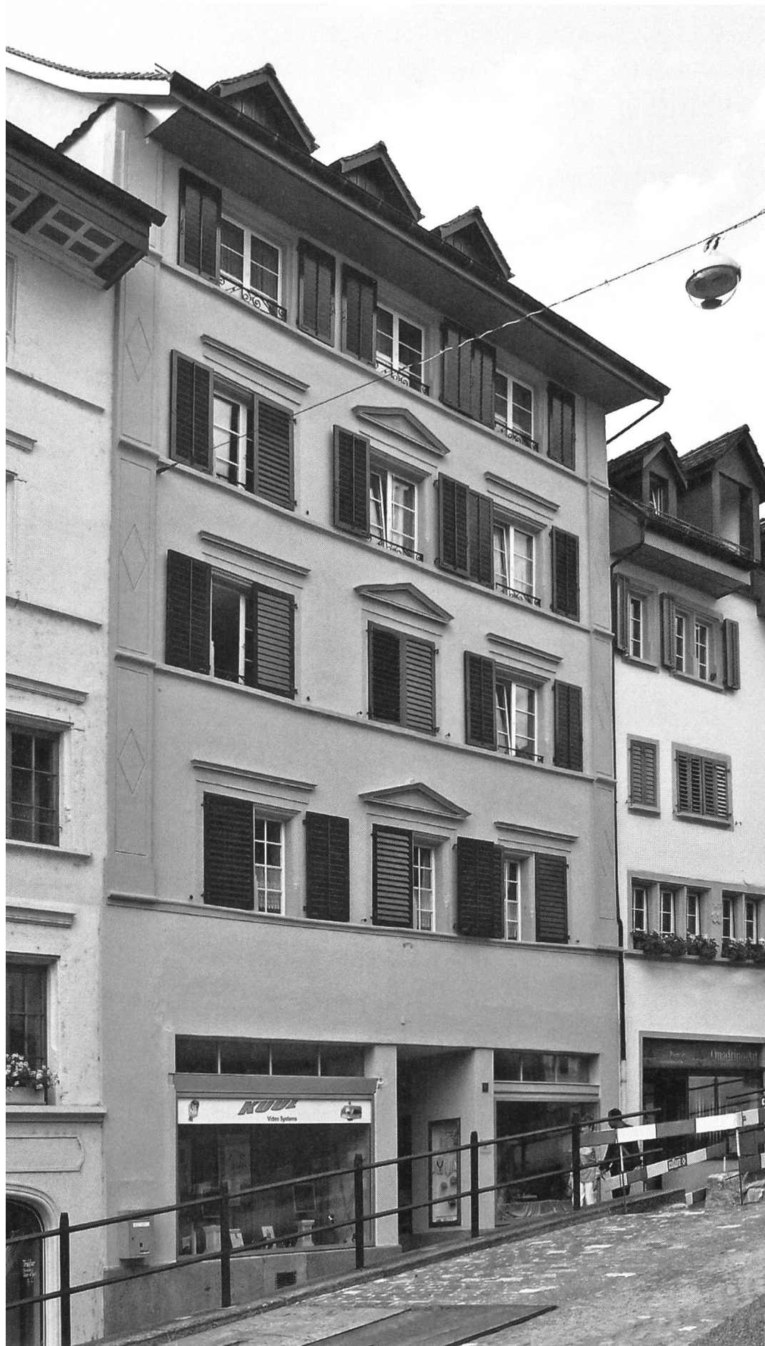
Im Haus «zum Strauss» am Bogen Nr. 10 befand sich nach 1712 die Landschreiberei der Untern Freien Ämter.