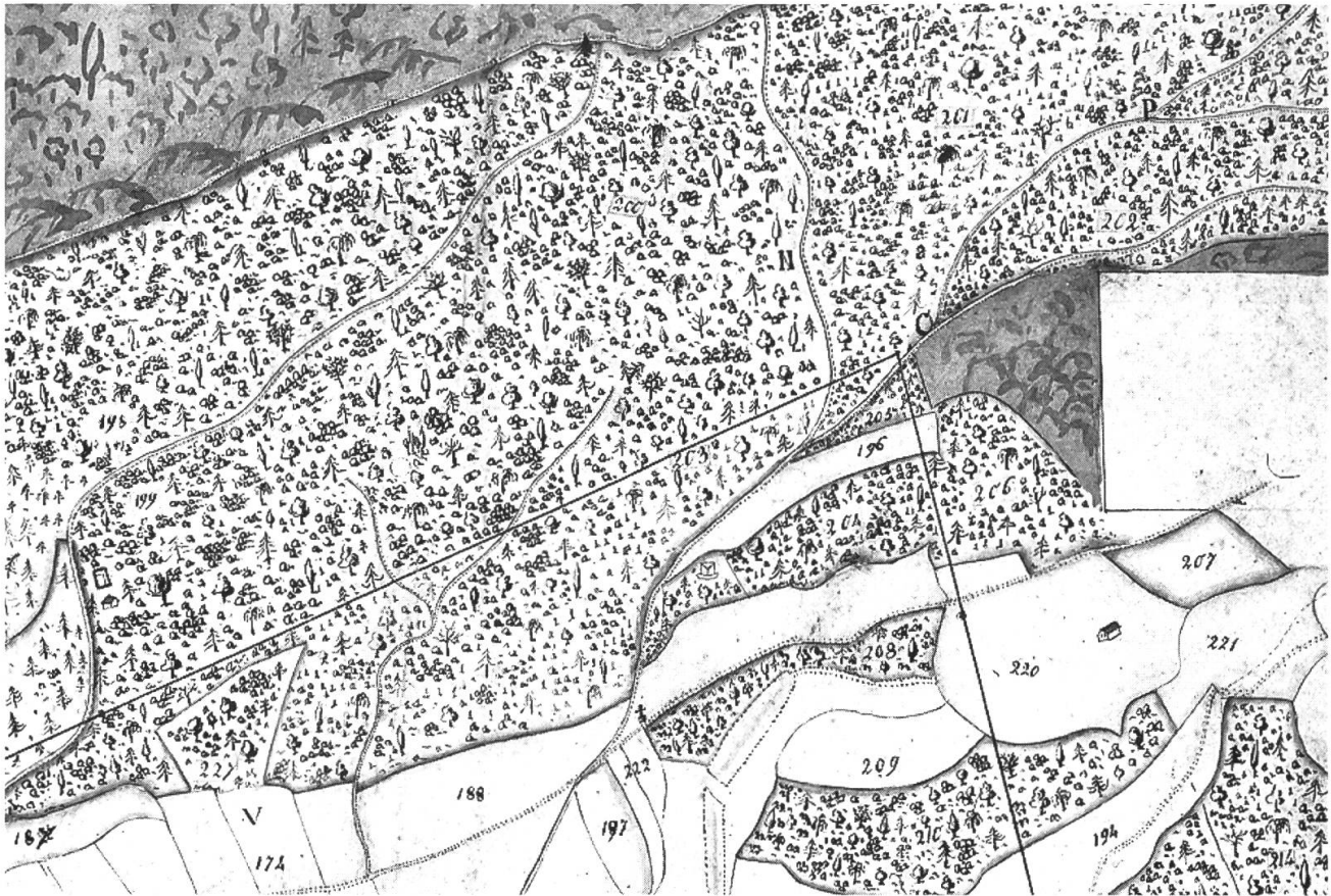
Ausschnitt aus dem Plan des Bremgarter Waldes von Joseph Ulrich Perret, um 1820. Er vermittelt einen Eindruck der damaligen Waldnutzung: grosse Bäume in lockeren Abständen, dazwischen niedriges Staudengehölz. In diesem Gehölz bekämpften sich die feindlichen Truppen.

Leute. Und die Berner Offiziere mit ihren prachtvollen Uniformen und wehenden Federbüschen waren dankbare Ziele für die hinter den Bäumen versteckten Innerschweizer Schützen. Ein entsetzliches Feuer beiderseits habe es gegeben, berichtete ein Berner Feldprediger «dann (denn) da war kein Quartier (kein Pardon) auf keiner Seiten, es musste ohne Gnad gestorben sein.» Und ein Berner Hauptmann schrieb nach Hause: «Wann ihr die Leuth alle so erbärmlich zerstochn und zerhauwen gesehen hätten, wie ich und andere, es würde wahrhaftig eüch die Hor gen Berg aufstehen machen.» 1)