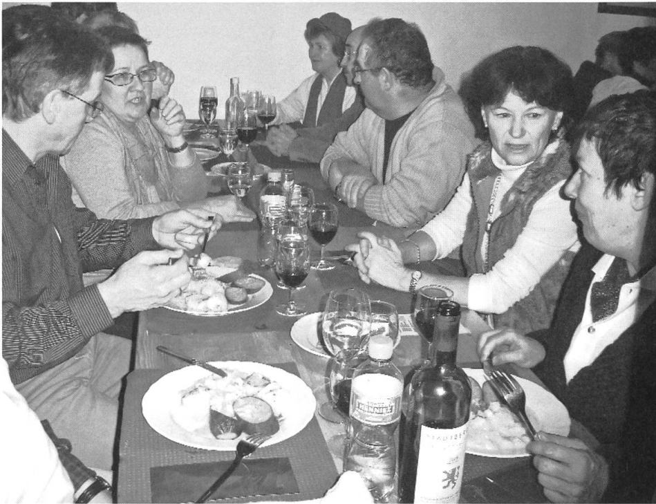
Grossansturm beim Treberwurstessen der Ortsbürger. Über 300 Portionen werden angerichtet.

bei ihrem Treberwurstessen. Über 300 Portionen werden angerichtet. – Der 29. Reusslauf übertrifft alle bisherigen. 3572 Läuferinnen und Läufer werden klassiert. Mit 32.41.8 Min. stellt der Äthiopier Kadi Nesero einen neuen Streckenrekord auf.