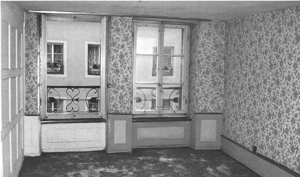
Das war unser Schlafzimmer gegen die Marktgasse hinaus.