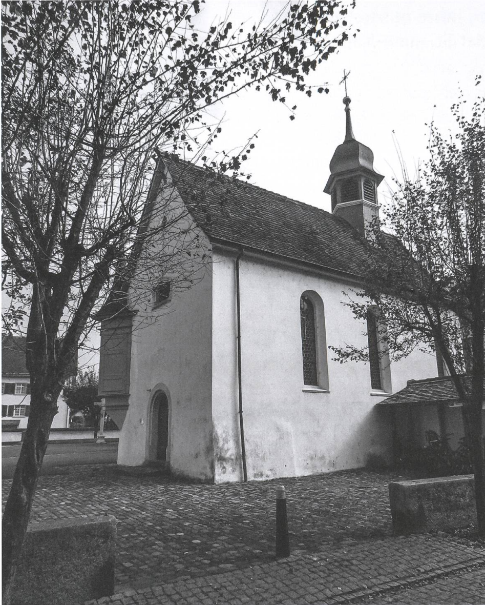
Die Anna-Kapelle im Bremgarter Kirchenbezirk.

tastrophe des 28. März 1984 und an das «Auferstehungswunder». Noch immer schien der Schock, den der Brand ausgelöst hatte, gegenwärtig zu sein. Doch die Freude über den glanzvollen Wiederaufbau liess den schlimmsten Tag in der neueren Geschichte Bremgartens vergessen.