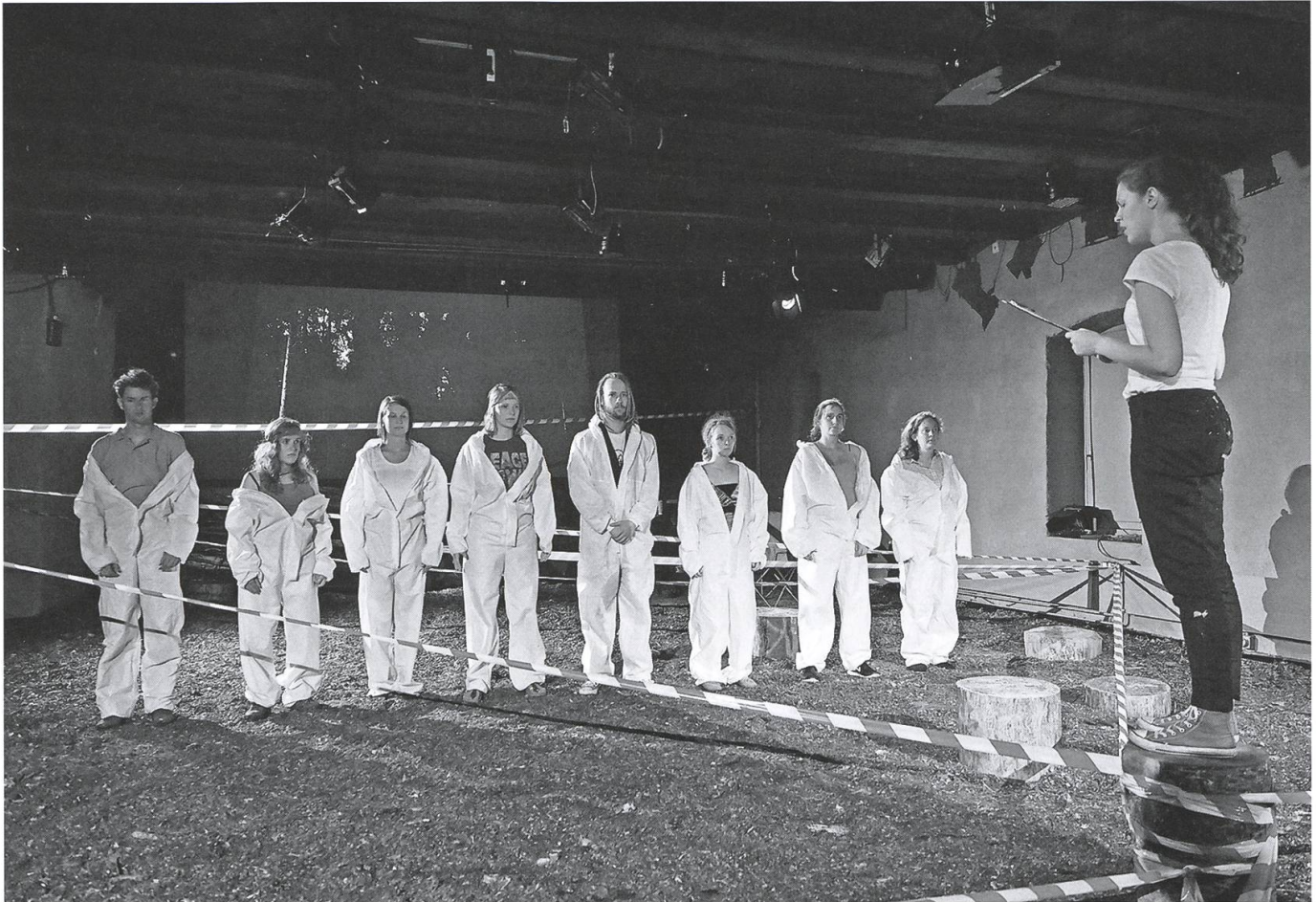
«Wald:Park», das zweite Projekt der «Jungen Bühne», der neuen Eigeninszenierungssparte des Kellertheaters August 2016. Inszenierung Simon Landwehr.

Erdgeschoss verloren. Dafür wurde die Wohnung im dritten Stockwerk aufgelöst und dem Theater als Büro und für sonstige rückwärtige Räume zur Verfügung gestellt. Dies löste einige der zuvor bestehenden Platzprobleme.