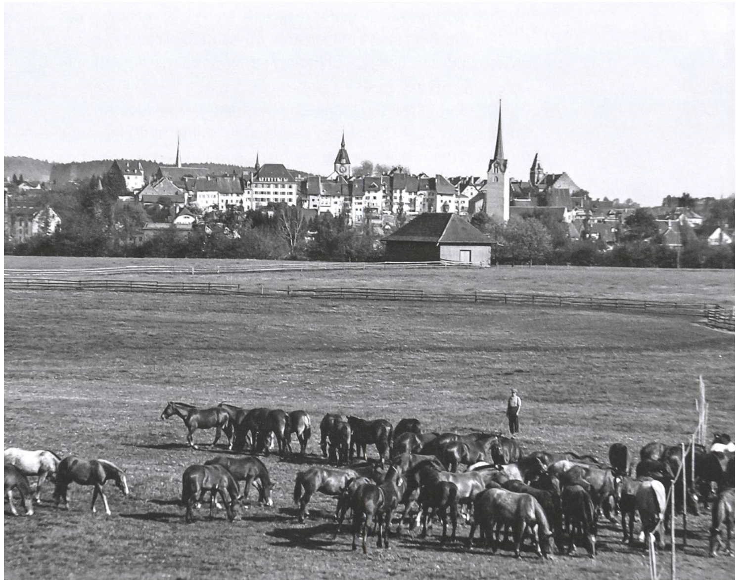
Freiberger-Herde mit altem Schützenhaus im Hintergrund um 1958. Standort heutige Soldatenstube/Cafè Fohlenweid.