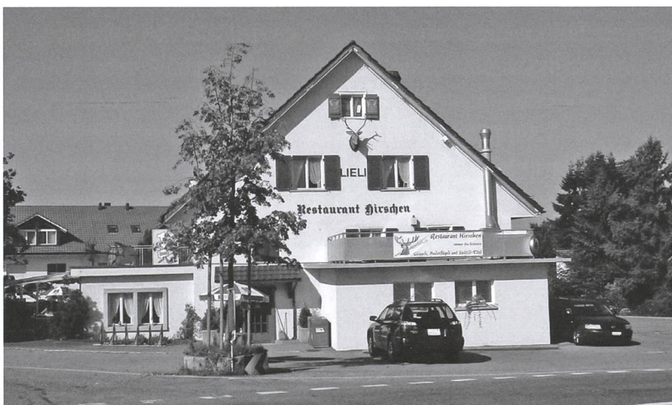
Das Gasthaus zum Hirschen in Lieli heute.