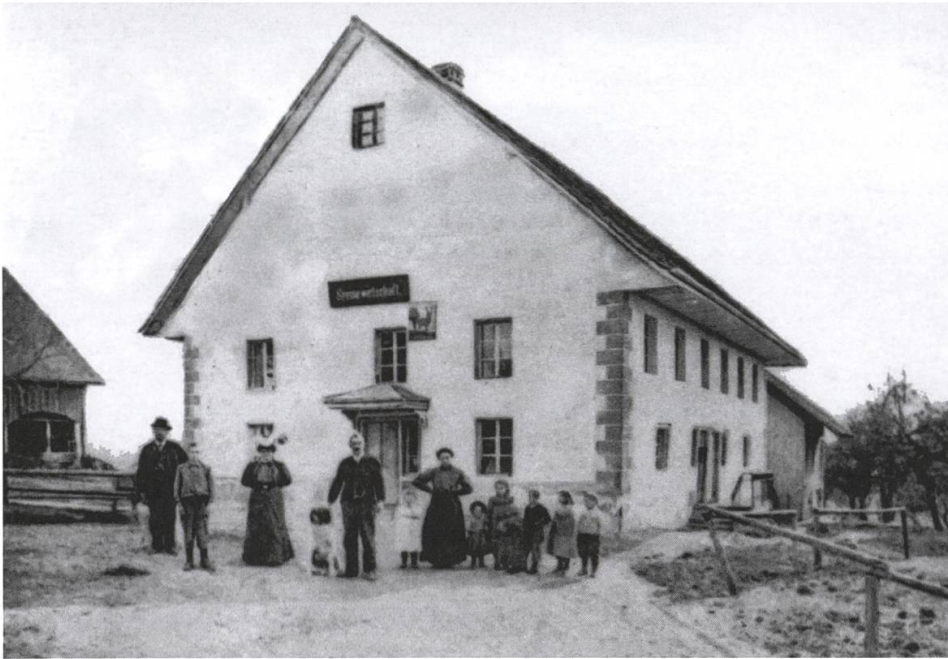
Das Gasthaus zum Hirschen in Lieli etwa um 1920.