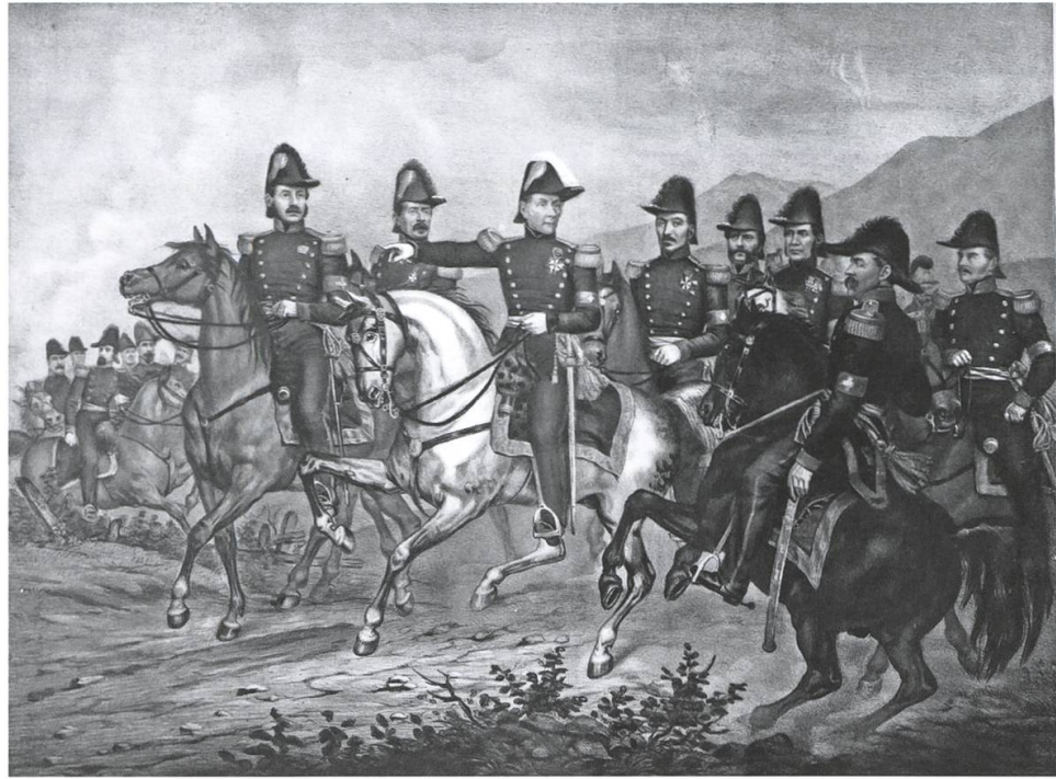
General Dufour, Kommandant der eidgenössischen Truppen im Krieg gegen den Sonderbund, umgeben von hohen Offizieren.

prozess verhört. Die Studenten erklären, dass sie in ihre Heimat reisen wollten, weil sie sich zu Hause sicherer glaubten, und dass sie ein weisses Fähnchen mitgeführt hätten, damit nicht auf sie geschossen würde. Einer der diensthabenden Offiziere teilt den beiden mit, er könne sie noch nicht entlassen. Sie würden auf die Hauptwache in Uznach geführt und noch einmal verhört. Füglistaller im Tagebuch: «Auf diese unerwartete Erklärung erschrak ich keineswegs, wurde aber etwas bitter und trotzig; ich drückte daher mein Befremden aus und es entspann sich ein kleiner Zank zwischen uns und den Offizieren.» Beim zweiten Verhör geht es hastig zu. «Tumult, Unruhe. Plötzlich stürmt ein Offizier mit unsern Papieren ins Zimmer: Sie sind entlassen, sie können gehen und sich in der Stadt ein Quartier suchen, um am Morgen weiterzugehen.» Im «Adler» kommen die Studenten über Nacht unter und ziehen weiter über Rapperswil und Zürich. «Wir getrauten uns aber nicht, in ein Wirthhaus zu gehen, auch nicht, den kürzeren Weg über Birmensdorf einzuschlagen, um nicht erkannt zu werden.» Um 9 Uhr abends (das Datum nennt Füglistaller nicht) erreicht er «ganz ermattet» das väterliche Haus. «Alle waren hoch erfreut über meine unerwartete Erscheinung und besonders die liebe Mutter war jetzt mancher Sorge enthoben. Es ist doch anfangs einer gerettet, sagte der Vater, den andern wird Gott auch wieder wohlbehalten zurückführen.»