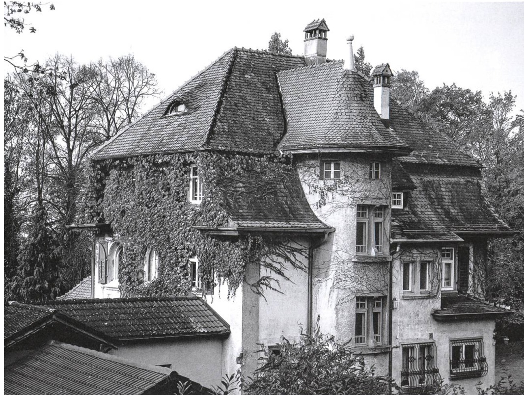
Das ehemalige Kurhaus Belvédère heute.