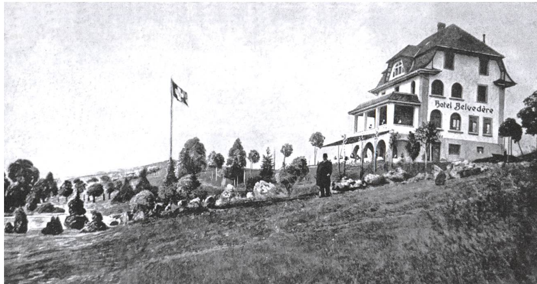
Aus einem Werbeprospekt des Kurhauses Belvédère. Jahr unbekannt.

für das Haus und einen Teich sind am Hang sehr schön angelegt. Im unteren Stock des Gärtnerhauses befanden sich der Stall für zwei Pferde, der Vorratsraum für Tierfutter und eine Kutsche für Ausfahrten und, nehme ich an, auch für die Einkäufe im nahen Städtchen.