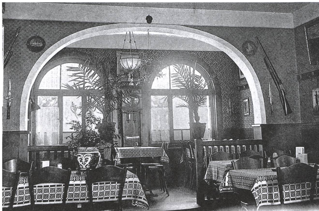
Der Speisesaal des Kurhauses Belvédère in einer zeitgenössischen Aufnahme.

Die Post für das Kurhaus wurde, gemäss Edith Karpf, einmal täglich durch das Postamt Berikon zugestellt. Telefonisch war das Kurhaus via Bremgarten unter der Nr. 15 ebenfalls erreichbar. Damals wurden die Gespräche von Hand gestöpselt, also eine Handverbindung erstellt, bis die halbautomatischen Zentralen Ende der 1930er-Jahre in Betrieb genommen wurden.