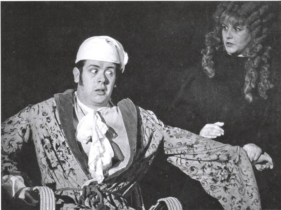
Szenenfoto der Aufführung von Molières «Der eingebildete Kranke» im Januar 1966.

Die Jungmannschaft erhielt die bischöfliche Erlaubnis, am Samstagabend zu spielen. Sonst gestattete die Kirche keine Anlässe am Vorabend des Sonntags.