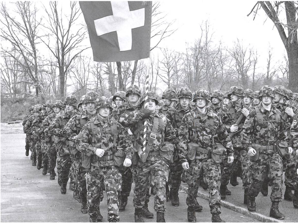
Momoll – Wir dürfen unsere Armee zeigen.

Zurückgezogen haben sich die Militärs aus dem Alltagsbild des Reusstädtchens schlauerweise nicht. Man soll und darf sehen, was «die Uniformierten da unten» mit unseren Steuergeldern Sinnvolles unternehmen, die «Bürger in Uniform». Regelmässig enden Gewaltmärsche und der Abschluss von Nachtübungen auf der Bremgarter Holzbrücke. Die Brevetierungen neuer Chargierten finden in der Öffentlichkeit statt. Und auch schon ritt eine stolze Veterinär-Offiziersschule hoch zu Ross durch die Stadt. Das freut die Bevölkerung durchaus.