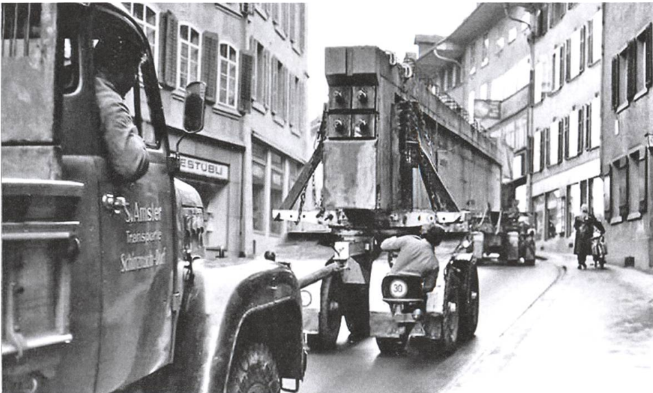
Vorne wird gezogen, hinten wird mit der Stange geschoben: Heikler Transport der vorfabrizierten Hohlkörper-Betonelemente, hier durch die enge Altstadt von Brugg, aufwärts.

Kommando- und Offizierstrakt mit Krankenabteilung, mit eigener Poststelle, Wachtgebäude und Motorwagenhalle mit Werkstatt und Tankanlage. Etwas oberhalb dann eine grosszügige Mehrzweck- und Sporthalle, die auch den städtischen Sportvereinen zur Verfügung steht – und nicht zu vergessen das «Kafi Fohlenweid», das zum beliebten Znüni-Treffpunkt und zur Schnittstelle zum zivilen Handwerk und Gewerbe wurde. Investiert wurden damals 30 Millionen Franken, davon sieben Millionen für Landerwerbe, Erschliessungen und Schiessanlage, die Kasernenbauten kosteten gut 16 Millionen Franken. Die Besitzverhältnisse im Waffenplatzperimeter sind heute noch dieselben: 100 Hektaren gehören dem Bund, zehn dem Kanton Aargau, fünf der Stadt. Die Bewirtschaftung der «fremden» Ausbildungsplätze ist geregelt in Form von Nutzungsverträgen. Abgrenzungen zur Fohlenweid westlich der Kaserne, den Ortsbürgern gehörend und vermietet an die Pferdezuchtgenossenschaft, waren problemlos und unkompliziert.