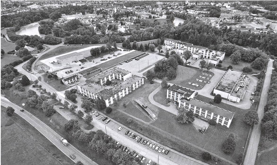
Die Genie-Kaserne heute, im Gegenurzeigersinn: Theorie-Gebäude, Verpflegungszentrum, vier Kompaniehäuser, Rundholzlager in der Au, Kafi Fohlenweid, neueste Halle «UB», Motorwagen- halle, Wachtlokal, Kommandogebäude, Feste Brücke 69 mit Schützenpanzer M113.

in der aargauischen Milizverordnung 1817 sind unter den Truppengattungen des damaligen Schweizerischen Heeres erstmals die Pontoniere erwähnt. Zu Übungszwecken fanden jeweils in Aarau Pontonier-Wiederholungskurse statt, bis der Regierungsrat sie 1847 nach Brugg verlegte. Pontoniere und Sappeure hatten das schwere Material und die Boote notfalls von Hand ans Wasser zu bringen, wenn der Train und seine Pferde fehlten. Die Ausbildung wurde nicht nur in Brugg betrieben, einzelne Brückeneinbaustellen an Aare und Reuss waren sehr beliebt.