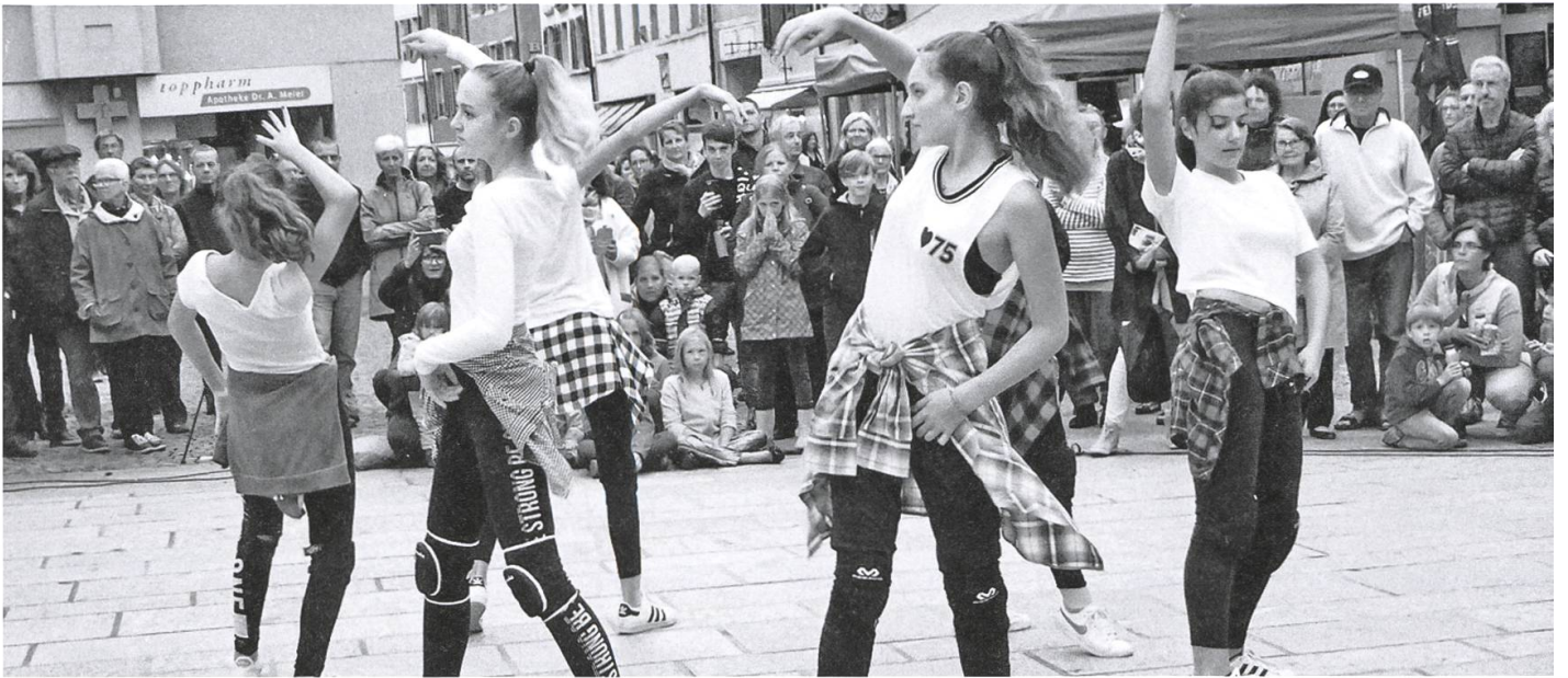
Der Verein Fachgeschäfte Altstadt eröffnet seinen Kunstmonat September mit einem attraktiven Programm. Bild: Auftritt der Tanz-Fabrik.