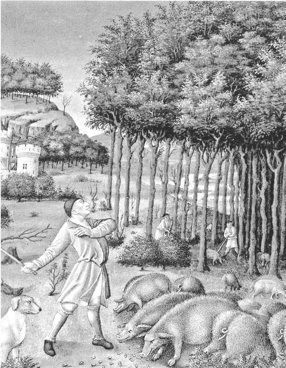
Acherig oder Eichelmast. Noch bis ins 19. Jahrhundert war es üblich, die Hausschweine in den Wald zur Weide zu treiben. Wenn sie ausgiebig Eicheln fanden, gediehen die Schweine besonders gut. Aus dem Stundenbuch des Herzogs von Berry, 15. Jh.

frische Kirschen und Weichseln an ihre Hüte. Aber so richtig freuen mag sich niemand: «Man sagt, es wurde (würde) ein sterbent mitbringen; hab acht!». Nichts Gutes verheisst wohl auch der Komet, den man vom Montag nach Martini (14. November) nacheinander in vier Nächten zwischen sechs und sieben sowie zwischen drei und vier gegen den Birrenberg hin sieht.