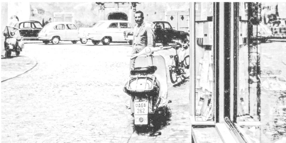
Motorräder vor der Velohandlung Boller. Im Hintergrund das Weissenbachhaus. Man beachte die parkierten Autos.

Ja, und doch gab es immer wieder Einzelne, die sich lossagten und das taten, was sie für richtig empfanden. Man musste dann damit leben, dass man ausgegrenzt wurde und dass es ein erbarmungsloses Geschwätz gab.