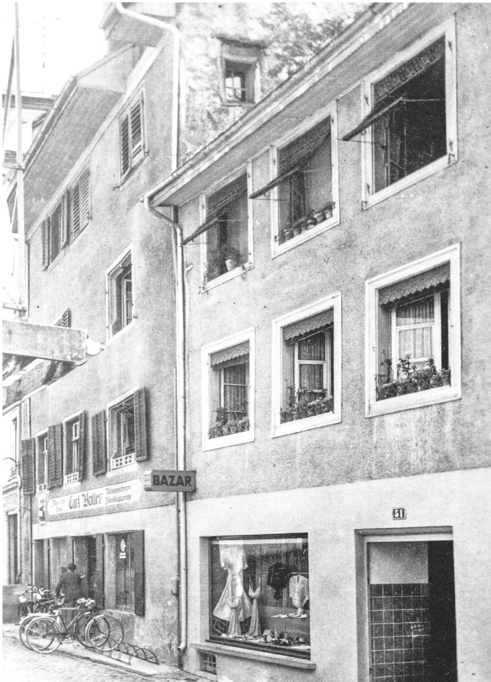
Ein Stück Antonigasse. Links die Velohandlung Boller, wo man jeweils ein Velo für einen Tag mieten konnte.

Wir waren gute Schwimmerinnen (ich gehe noch immer regelmässig schwimmen)! Wir schwammen über die Reuss, badeten beim Hexenturm, durchquerten den Kanal in der Papieri in der Reussgasse, den es heute nicht mehr gibt. Als bald Erwachsene schwammen wir auch die Strecke von der Hegnau bis nach Meltingen. Den Fällbaum hinunter zu schwimmen, war verboten. Das trug uns einmal eine Busse des Stadtpolizisten ein. 11 Franken mussten wir bezahlen. Wir brachten diese Summe in Einröpfeln zu ihm. «Röllele!» lautete dann der Befehl. Also packten wir brav die vielen Münzen wieder zu Rollen zusammen.