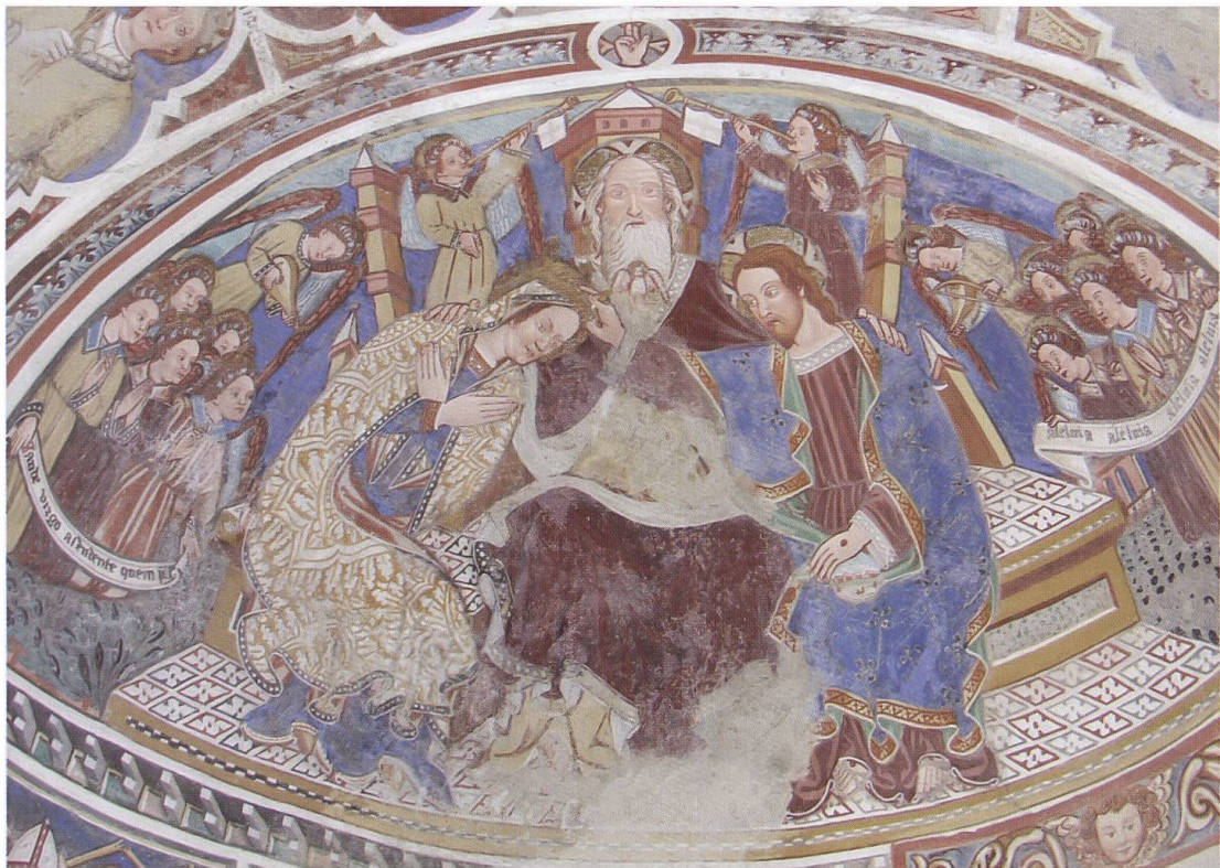
7. Chiesa di Sant'Ambrogio Vecchio di Negrentino: Incoronazione della Vergine.

Rimangono infine da segnalare due ulteriori opere di grande importanza nell'attività di Antonio da Tradate, le quali, seppur non firmate, gli vanno giustamente attribuite: la decorazione della navata destra della chiesa di Sant'Ambrogio Vecchio (oggi San Carlo) a Negrentino e la Presentazione al Tempio in Santa Maria in Selva a Locarno. Il ciclo pittorico di Negrentino mostra un chiaro legame stilistico con le pitture di Palagnedra, riferibili al periodo di massimo spicco dell'attività del nostro artista. In questa fase matura Antonio dimostra anche una conoscenza della pittura milanese, come si può osservare nell'Incoronazione della Vergine (Foto 7) nel catino absidale della navata destra della chiesa di Sant'Ambrogio, la cui scelta iconografica trova antecedenti negli affreschi di medesimo soggetto del Bergognone, nel transetto sinistro della Certosa di Pavia o in quello dell'abside di San Simpliciano a Milano. Colpiscono le decorazioni eleganti e raffinate e quel senso di horror vacui che spinge il pittore a ricoprire ogni minimo spazio della superficie con colori brillanti. La narrazione pittorica, dedicata alle storie mariane, segue un'insolita scansione, iniziando nei riquadri collocati nell'abside con andamento da destra a sinistra, continua sul pilastro divisorio fra le due absidi con la Natività, prosegue sull'arco diviso-