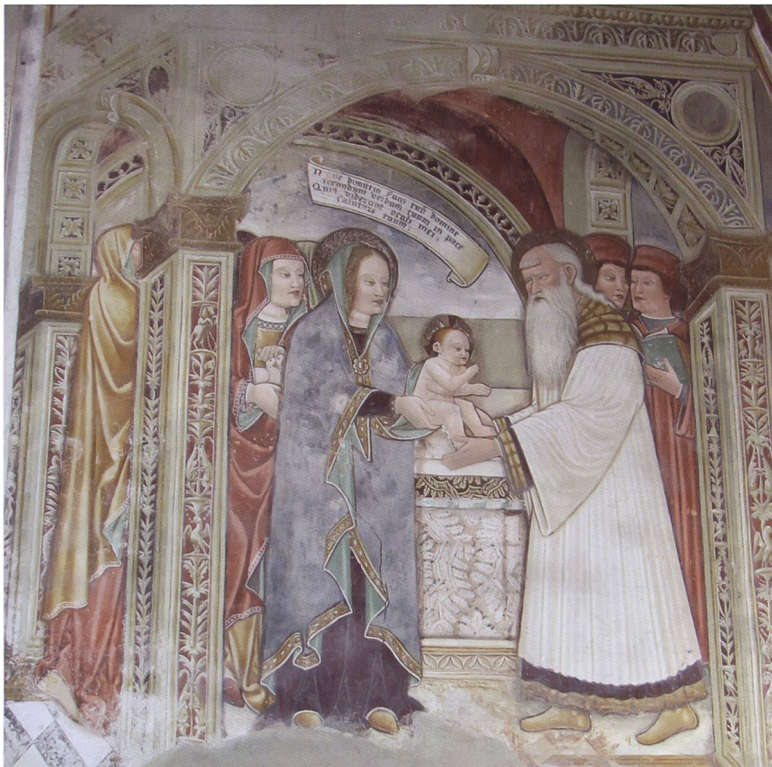
8. Chiesa di Santa Maria in Selva, Locarno: Presentazione al Tempio.

Sia la decorazione di Negrentino, che il dipinto di Santa Maria in Selva andrebbero datate tra la fine degli anni novanta del Quattrocento e il primo decennio del Cinquecento, ipotizzando poi un'esecuzione di qualche anno