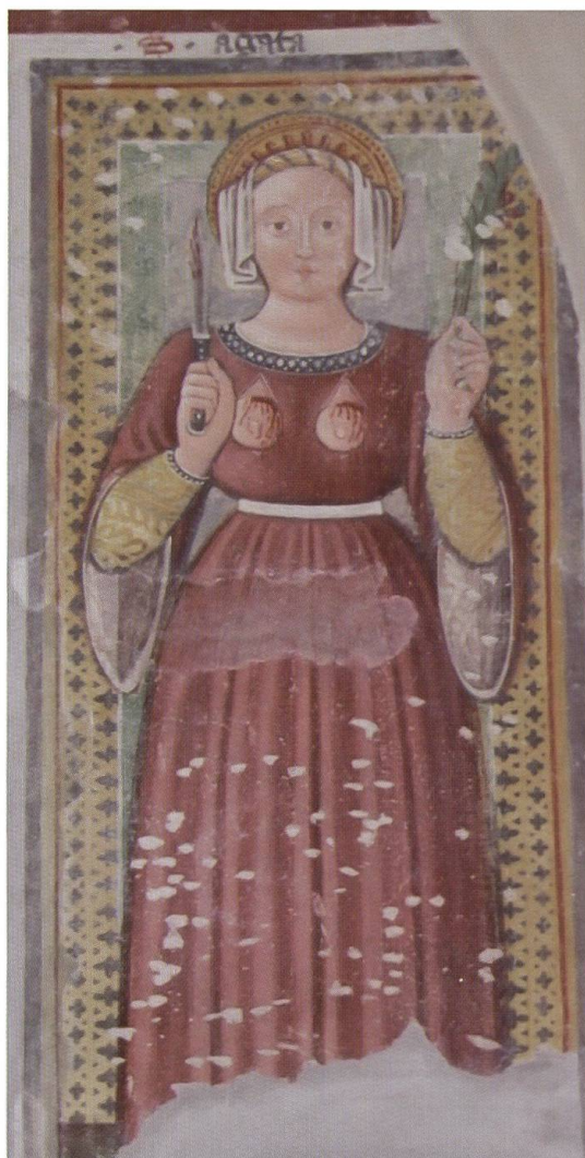
1. Oratorio di San Bernardino, Ronco di Gerra Gambarogno: particolare di Sant'Agata.

Al momento attuale siamo a conoscenza di cinque cicli pittorici che recano data e firma di Antonio da Tradate, permettendoci così di fissare dei punti saldi all'interno della sua attività nell'arco di venticinque anni: Ronco di Gerra Gambarogno, Ronco sopra Ascona, Palagnedra, Arosio e Curaglia. La più antica decorazione muraria a noi nota è quella, seppur frammentaria, dell'oratorio di San Bernardino a Ronco di Gerra Gambarogno, dove nell'iscrizione presente sulla parete settentrionale, riscoperta in seguito ai restauri del 1966, si può leggere distintamente la data, 11 maggio 1485, e il nome dell'esecutore, un misterioso Antonius , mentre il restante intonaco è andato perso in seguito all'apertura di una porta secentesca. Un'indagine stilistica dell'immagine di Sant'Agata (Foto 1), unica figura conservatasi quasi interamente, rivela alcuni punti di contatto con la successiva produzione di Antonio da Tradate, seppur con alcune incertezze e semplificazioni giustificabili nell'ambito di una produzione giovanile. In seguito a questa considerazione, l'anno di esecuzione di tali affreschi, il 1485, si pone come primissima data riferibile al nostro artista, attestando così una fase iniziale,