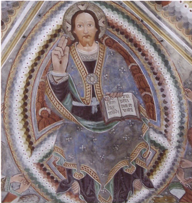
4. Chiesa di San Michele, Palagnedra: Majestas Domini .

gruppo delle Pie Donne di Palagnedra è avvertibile anche un'eco lombarda alla pittura di Bergognone, soprattutto improntata all'esperienza pavese di fine XV secolo; a tal proposito si prenda in considerazione la Crocifissione del 1490 della Certosa di Pavia, che sembra fungere da modello per l'impostazione iconografica della parete orientale di Palagnedra. Questa impresa si segnala come un'esecuzione raffinata ed elegante, che nel suo effetto di insieme suggestiona per la freschezza e l'armonia delle immagini. La Majestas Domini (Foto 4) e il Tetramorfo dal corpo umano 24 , di reminescenza bizantina, il bel San Michele affiancato da Santi e i Dottori della Chiesa Latina, così come i tondi prospettici da cui si affacciano i profeti, omaggio all'esperienza foppesca degli anni Sessanta del Quattrocento a Milano, testimoniano la volontà dell'artista di far emergere le proprie abilità tecniche e il proprio aggiornamento culturale. Persistenza tardogotica mostrano però i panneggi, che non descrivono le forme anatomiche, ma attraverso le pieghe tendono a delineare solo motivi simmetrici e ornamentali, in stretto