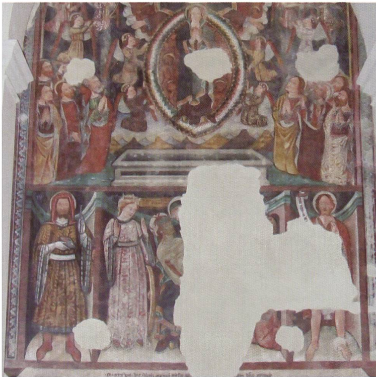
5. Chiesa di San Michele, Arosio: Assunzione della Vergine e Pietà con Santi.

dare quello presente nella pittura piemontese del Giaquerio 33 . In questo ciclo pittorico però risalta anche la caduta di stile, sottolineata da una perdita di eleganza e pathos emotivo nella resa dei volti e dei volumi, tendenza questa riscontrabile anche nelle immagini delle pareti laterali del coro; questo fatto sarebbe imputabile al largo intervento di aiuti e del figlio, mentre il Maestro si sarebbe semplicemente limitato a sovrintendere e poi firmare il lavoro. La struttura a piccoli riquadri utilizzata per impaginare gli episodi della vita di Cristo sulle pareti laterali del coro fu forse ispirata all'artista dagli affreschi del coro 34 di Santa Maria della Misericordia di Ascona (prima metà del XV sec.), in cui il Tradate lavorò nel 1490 35 , con la realizzazione della Madonna in trono sulla parete laterale sud della navata e successivamente con la teoria di Santi del 1506 sulla medesima parete. In riferimento all'iconografia di questi santi è molto interessante osservare la figura del San Sebastiano, con una freccia curiosamente conficcata nella fronte, riproposta anche nella cappella della Madonna delle Scale a Corzoneso, che trova precedenti nel San Sebastiano di Nicolao da Seregno a Lottigna.