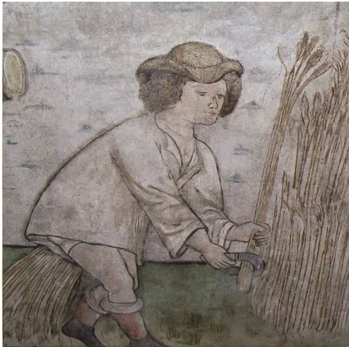
2. Chiesa di San Martino, Ronco sopra Ascona: particolare del mese di Luglio.

Nonostante la teoria dei Santi risulti molto danneggiata, si può comunque constatare la grande somiglianza con le pitture di Palagnedra, la cui datazione dovrebbe collocarsi a ridosso di quest'ultima.