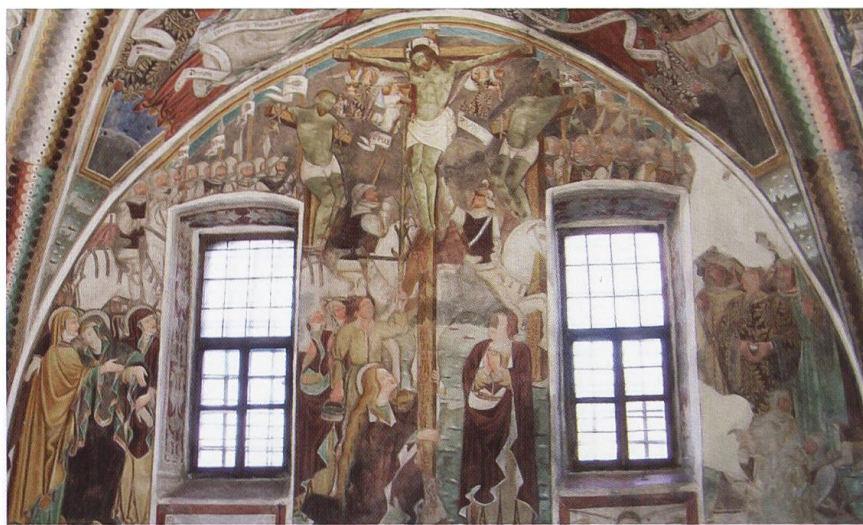
3. Chiesa di San Michele, Palagnedra: Crocefissione.

L'opera di Palagnedra è forse il vertice della carriera di Antonio da Tradate, che qui rivela un aggiornamento sulla cultura milanese, seppur filtrata dall'esperienza comasca del pittore Andrea de Passeris di Torno, col quale il nostro artista potrebbe essere entrato in contatto. È verosimile credere che il pittore di Torno possa aver influenzato anche l'attività di Antonio da Tradate, il quale poi reinterpreta, in base alle proprie capacità esecutive, gli influssi che gli giungono dalla cultura rinascimentale; a tal proposito si veda il gruppo delle Pie Donne che sorreggono la Madonna straziata dal dolore alla vista del Figlio morto, ai piedi della Crocefissione di Palagnedra (Foto 3). Seppure l'andamento dei panneggi sia ancora marcatamente legato al repertorio del tardogotico internazionale, con le rigide linee spezzate delle vesti e la scarsa resa volumetrica, si avverte tuttavia qualcosa di nuovo nei volti, una tensione carica di pathos emotivo che definisce le espressioni dei tre personaggi presenti nella scena. In questa tensione sentimentale si scopre un richiamo alla pittura ferrarese sicuramente mediata da un artista come il de Passeris, che a Ferrara aveva lavorato, esecutore anche della tavola raffigurante l'Assunzione della Vergine, un tempo nella cappella Tridi in Santa Tecla a Torno e ora conservata alla Pinacoteca di Brera a Milano 23 . Nel