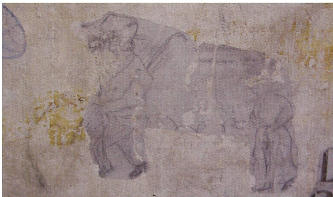
La donna al guinzaglio? (disegno 6)