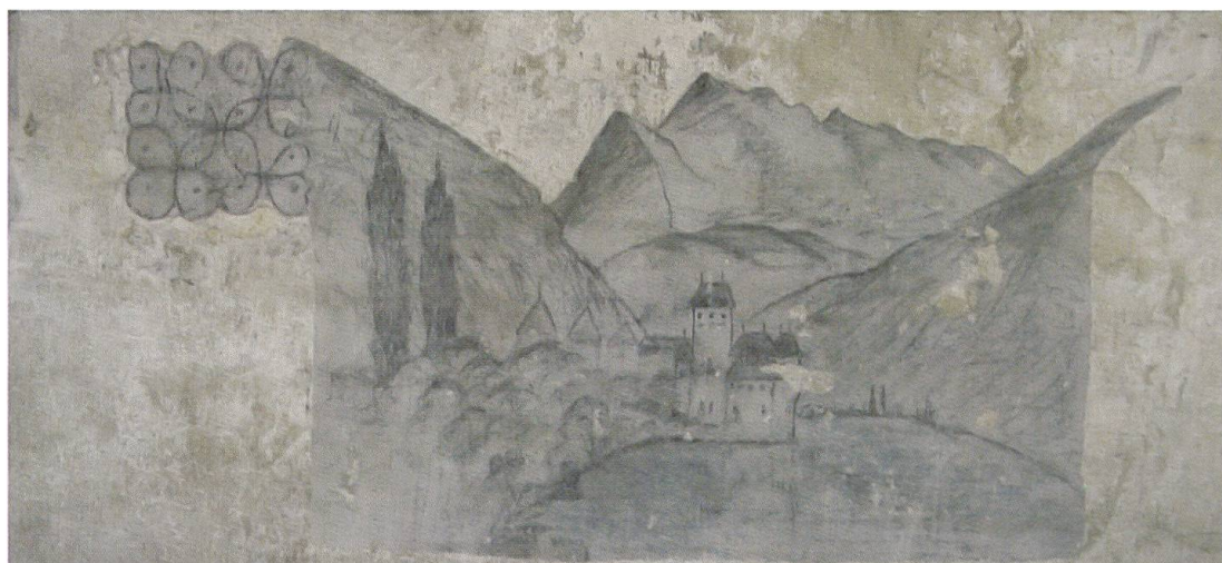
Il Castello di Chillon (disegno 15)