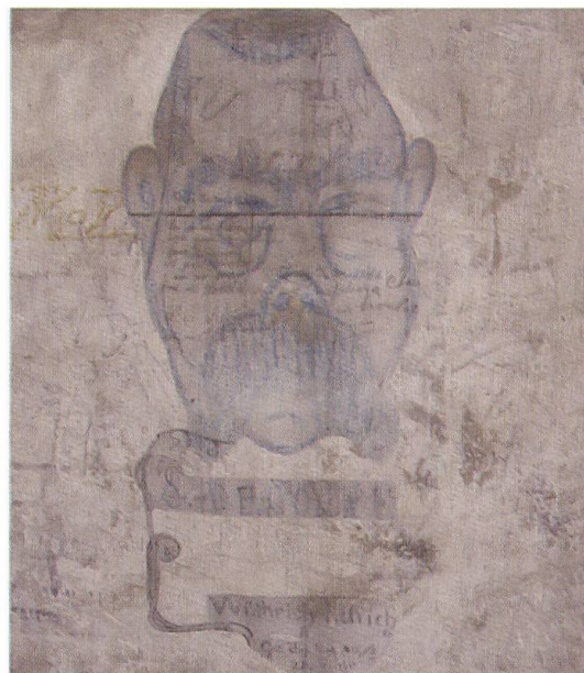
La donna danzante (disegno 4) e la caricatura di un politico (disegno 9)