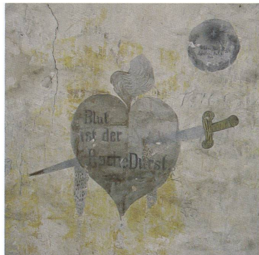
La Morte (disegno 17) e Il Cuore trafitto (disegno 19)