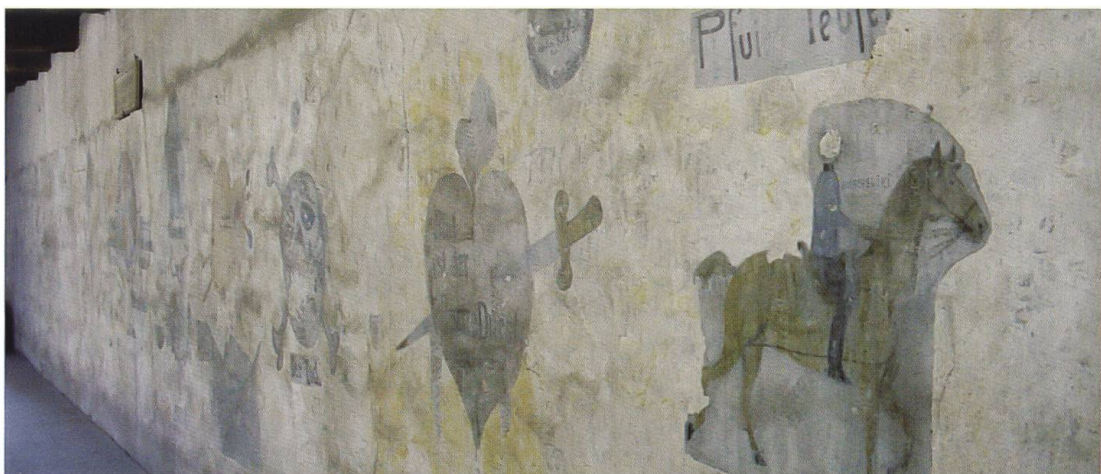
L'ultimo tratto della parete istoriata