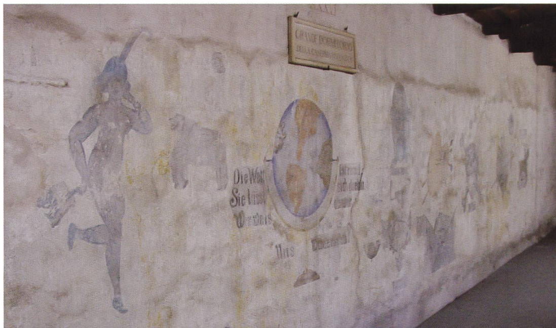
L'attuale "Sala del Patto di Locarno". Scorcio della parete a monte.

Riprendiamo oggi l'argomento per completarlo con quanto rilevato nella «Sala del Patto di Locarno» (la sala 33 della numerazione data da Edoardo Berta nelle sue piantine del Castello 2 indicata in situ come locale «XXXVI / grande dormitorio della caserma viscontea»). Le scritte e i disegni risalgono ai secoli XIX e XX e coprono tutta la lunga parete a monte dell'ampio locale. In occasione dei restauri degli anni 1921-1928 le parti più interessanti dell'intonaco che copre il muro erano state risparmiate, non scalpellate o rifatte o ridipinte, in previsione, forse, di un futuro recupero. La parete è oggi tuttavia coperta da pannelli espositivi: quanto descritto non è quindi direttamente visibile.