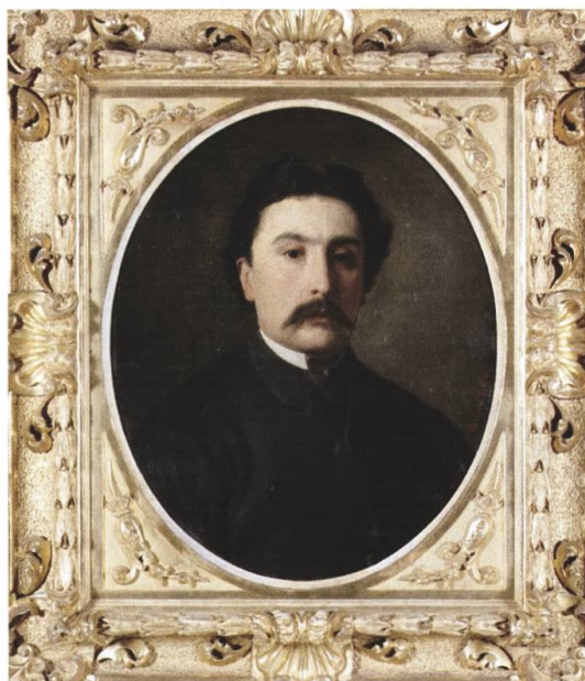
Ritratto di Federico Balli dipinto da Antonio Ciseri, Comune di Cevio

Federico Balli nacque a Locarno il 18 marzo 1854 in una distinta famiglia di Cavergho che si era arricchita grazie al commercio nelle Fiandre. Molto legato alla terra dei suoi avi, Federico si recava spesso e volentieri in Vallemaggia. Cresciuto in un ambiente cittadino ma al tempo stesso anche in una realtà valliva, il giovane Balli si trovò in una situazione in cui, in un periodo cruciale per il Locarnese, poté paragonare molto bene due realtà molto diverse fra loro: da un lato, il Locarnese, un'area che aveva conosciuto un rapido sviluppo turistico, e dall'altro, la regione della Vallemaggia che invece era rimasta discosta e ignorata dalla maggior parte dei viaggiatori. L'arrivo dei turisti nel Locarnese è da ricondurre all'attivazione, nel 1874, della ferrovia Biasca-Locarno e all'inaugurazione, nel 1876, del confortevole Grand Hôtel di Locarno. Il Balli poté subito apprezzare gli effetti positivi delle innovazioni quando rientrò dagli studi di scienze economiche svolti a Lovanio dal 1873 al 1876.