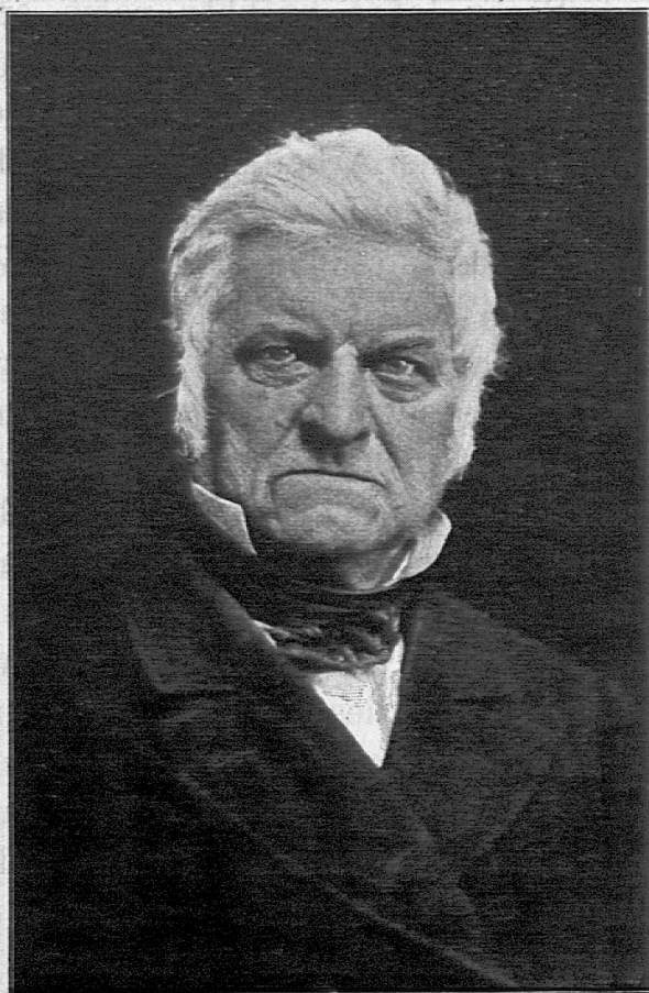
AUGUSTIN KELLER (1805—1883).

und gelehrt wurde, musste von uns zu Hause dem Inhalte nach „aufgesagt“ und oft auch niedergeschrieben werden. Wer nichts aus der Predigt sagen konnte, musste an der Ofenbank zu Mittag essen. Unterstützt von meinem Gedächtnisse, bekam ich nach und nach eine solche Übung im Auffassen von Vorträgen, dass ich bereits im zwölften Jahre jede Predigt ziemlich vollständig nachpredigte. Und als um diese Zeit mein mütterlicher Oheim infolge einer Krankheit erblindete, war ich alle Sonn- und Feiertage verpflichtet, ihm die angehörte Predigt vorzutragen und einen Abschnitt aus der Heil. Schrift oder aus der damals erscheinenden Kirchengeschichte von Stollberg vorzulesen.