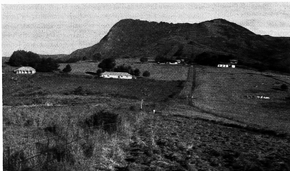
Nyafarou mit einigen Wirtschafts- gebäuden. Jetzt wird die Schule im Felde unten rechts gebaut.

La première classe vient de s'ouvrir à Nyafarou.