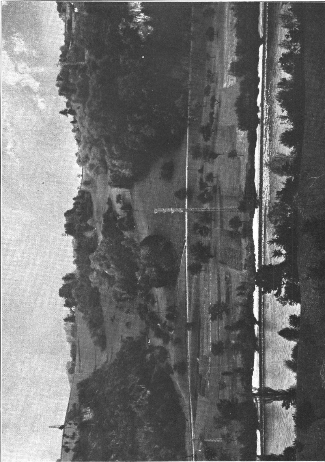
FIG. 2. — Sorties de la gorge des Chenalettes (prairies), versant occidental des collines. Au centre, ferme 440 ; à gauche, paroi hauterivienne ; à droite, paroi valangienne sous la ferme des Caillettes.