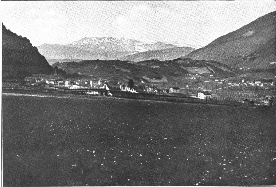
FIG. 3. — Les collines de Chiètres vues de l'amont. A gauche St-Maurice ; à droite Lavey-Village et col du Châtel avec les maisons de la Pâtissière ; au centre, ferme des Chenalettes, au pied du versant ; à sa droite, entrée de l'ancienne gorge.