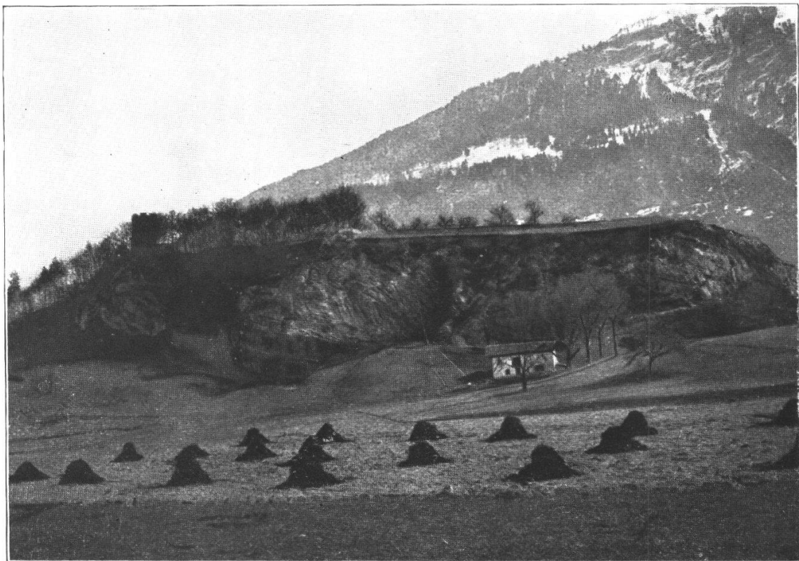
FIG. 4. — Le lambeau de recouvrement de la Tour de Duin (N-S). Calcaire jurassique en repos sur le Flysch.