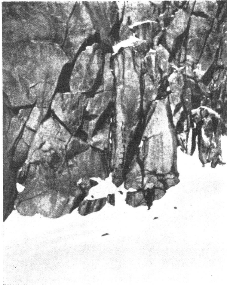
FIG. 1. — Nivomètre du Col d'Orny (3150 m).

FOREL dut attendre plus de douze ans la première réalisation de son idée en Suisse. En 1902 seulement, j'eus le privilège d'établir un premier nivomètre, peint au minium, en traits espacés d'un demi-mètre, immédiatement sous le col d'Orny, sur le chemin, alors très fré-