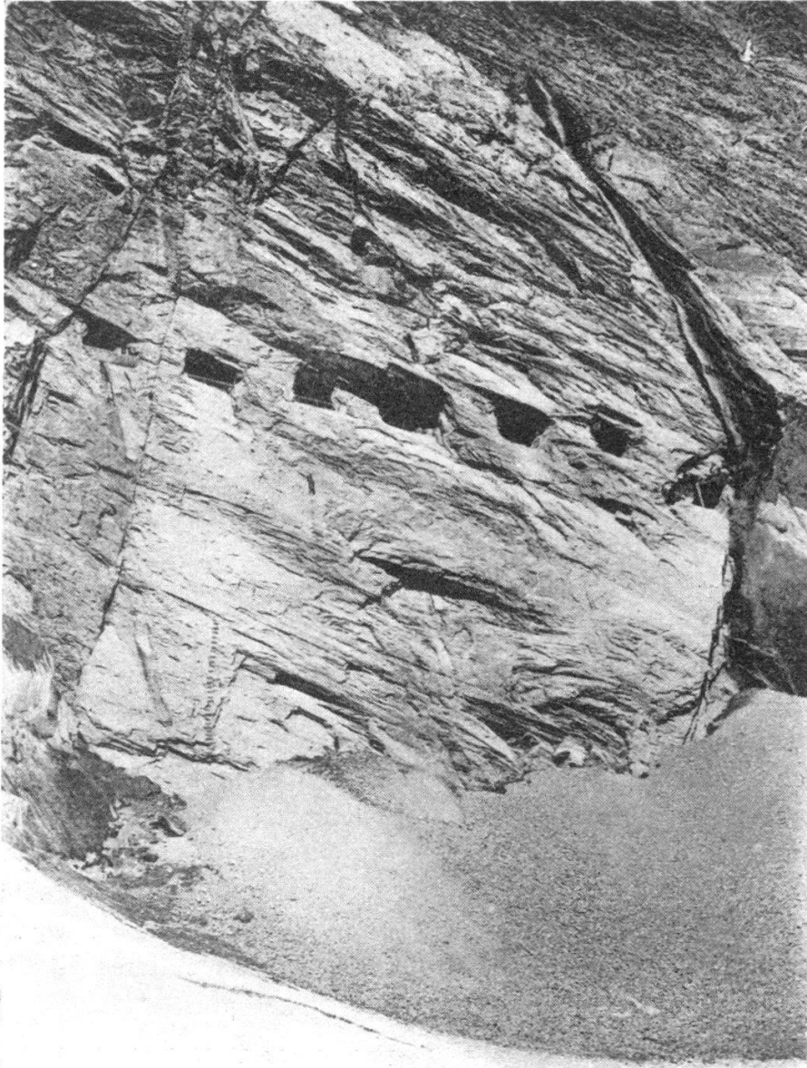
FIG. 5. — La station Eismeer (3160 m) à l'Eiger et son nivomètre.

Pour l'enneigement cinquanteaire on a eu : Maximum moyen 48 degrés dans les limites 32 et 78 degrés. Le maximum est intervenu