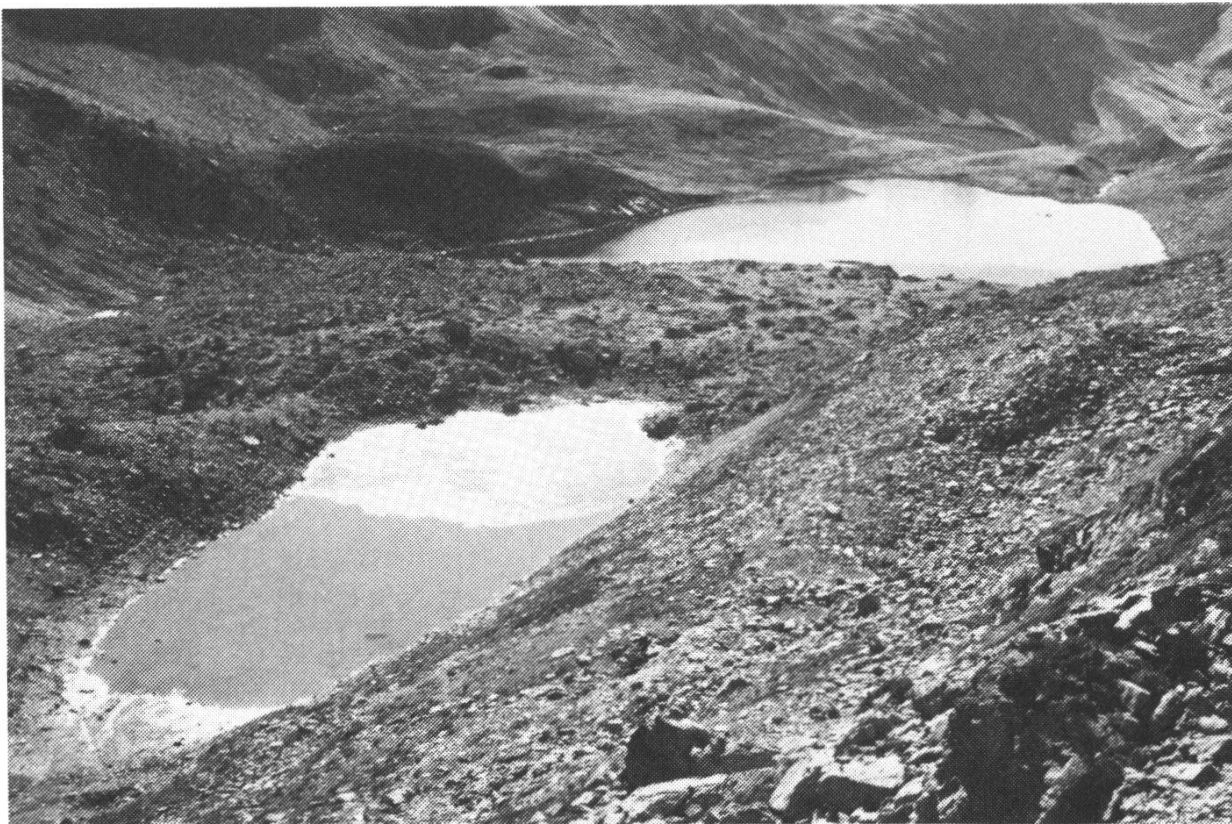
Figure 2.—Les lacs Jovet partiellement recouverts de glace (5.11.1987).

et une profondeur maximum de 8,5 m, avec une amplitude de variations d'environ 1 m. L'étude du petit lac Jovet a, quant à elle, été très succincte. Situé 300 m au NE du grand lac, il est également retenu par des moraines. Un affluent, au débit très variable selon la saison, lui amène entre quelques litres et une soixantaine de litres par seconde. De plus, des venues d'eau disséminées et faibles sont visibles sur sa rive nord. Sa superficie est très variable, passant d'un maximum de 1,74 ha à la fonte des neiges à 1 ha, à l'étiage d'arrière-automne. La profondeur en situation de crue atteint 9,4 m et l'amplitude des variations, 4 m. Ses exutoires sont souterrains. En effet, on observe à l'extrémité SW du lac deux pertes avec disparition d'eau entre les matériaux morainiques. En rive ouest, en deux points (appelés plus loin perte intermédiaire et perte nord), à l'aplomb d'affleurements de cargneule plongeant plus ou moins dans le lac selon son niveau, l'eau disparaît également entre des blocs.