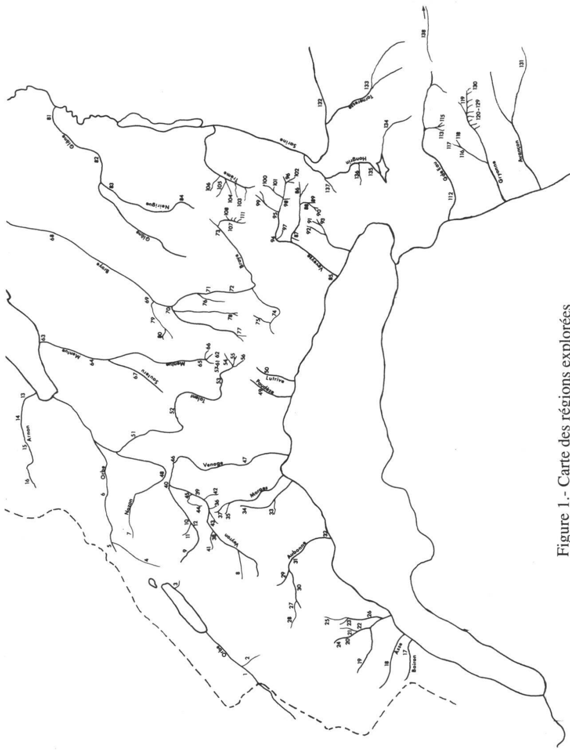
Figure 1.- Carte des régions explorées