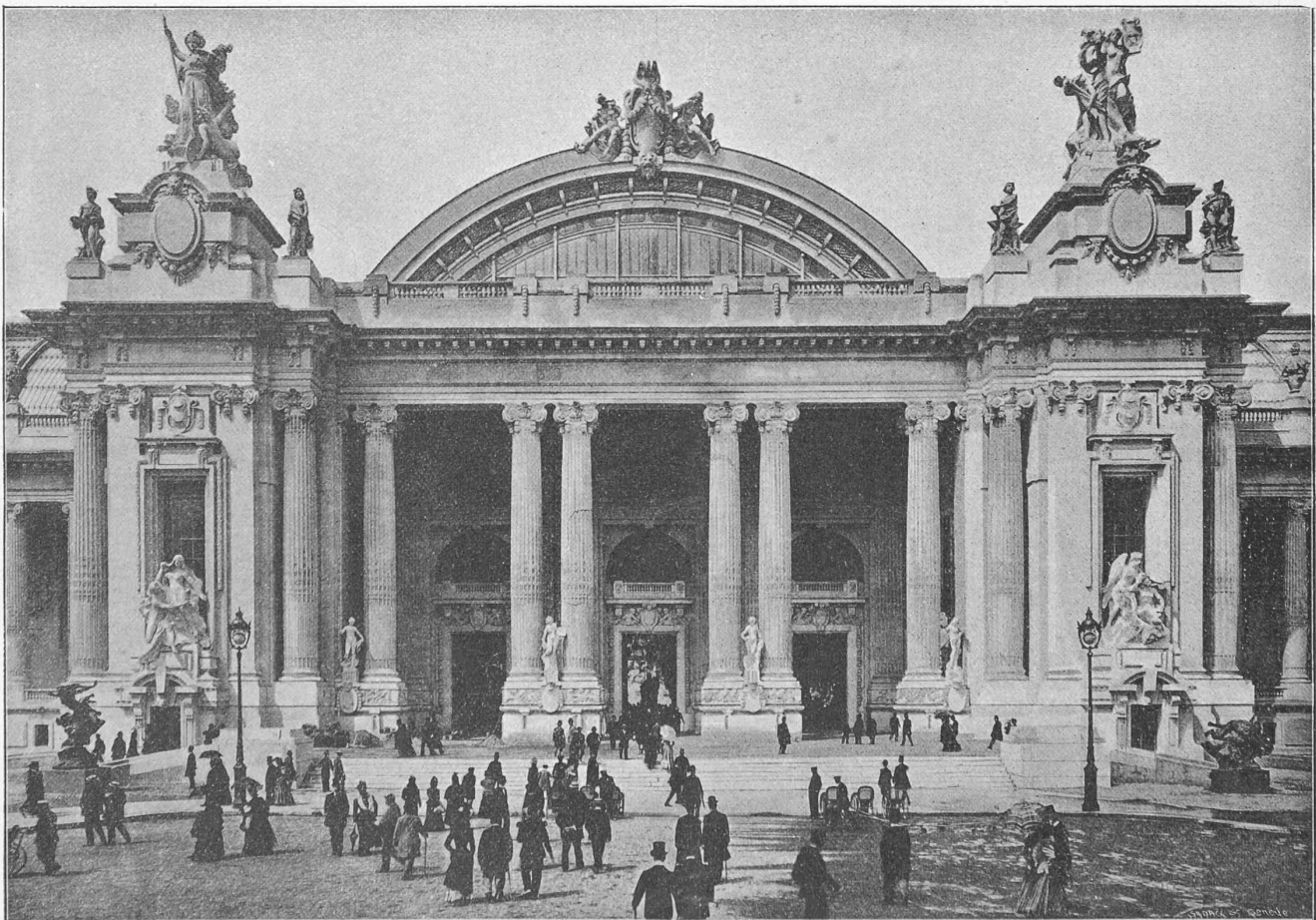
Fig. 2. — GRAND PALAIS (Entrée sur l'avenue Nicolas).

Ils sont situés sur la rive droite de la Seine, entre les Champs-Élysées et le fleuve (fig. 1). De l'autre côté, l'Esplanades des Invalides offre au regard une longue et belle perspective terminée par la coupole de Mansart. A l'heure actuelle, malgré les bâtiments de la rive gauche qui la restreignent un peu, cette perspective est réussie de tout point; l'effet boiteux que l'on aurait pu craindre des dimensions différentes des deux Palais des Beaux-Arts ne