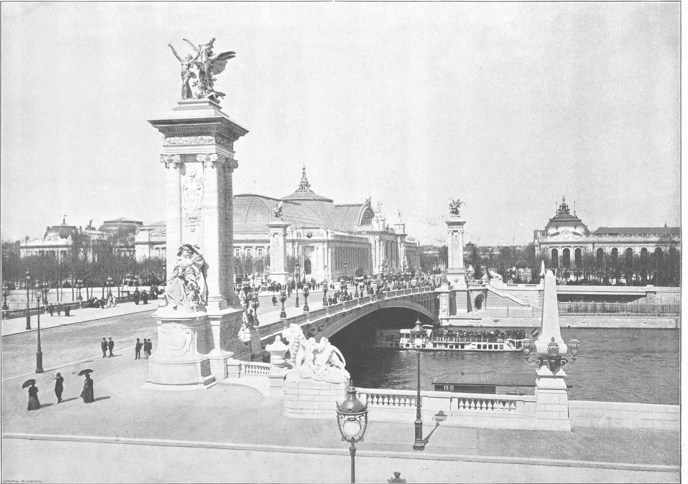
EXPOSITION UNIVERSELLE DE PARIS 1900. — Le Pont Alexandre III avec le Grand et le Petit Palais