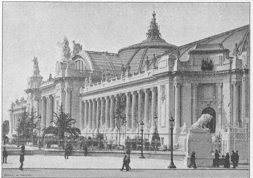
Fig. 3. — Portique sur l'avenue d'Antin.

La partie du grand Palais donnant sur l'avenue d'Antin (architecte M. Thomas) a des dimensions moindres (fig. 3). C'est un rectangle allongé, sur les petits côtés duquel sont des avant-corps. Le plan comprend une rotonde elliptique à coupole, sur laquelle viennent s'ouvrir diverses salles. Le bâtiment a un sous-sol, un rez-de-chaussée, un premier étage et des combles. Son entrée est un arc de triomphe dont l'ouverture est en plein cintre et forme