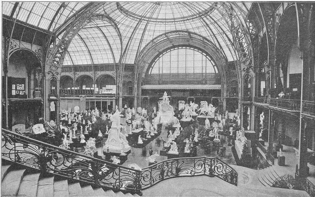
Fig. 5. — GRAND HALL (Arch. Thomas).

hardiesse étonnante et marque un des triomphes de la construction métallique. En effet, il est comme suspendu dans le vide. Il est soutenu par une disposition des piliers toute nouvelle et du plus riche effet; ceux-ci se transforment en une quantité d'arcs divergents, imitant des feuilles de roseaux.