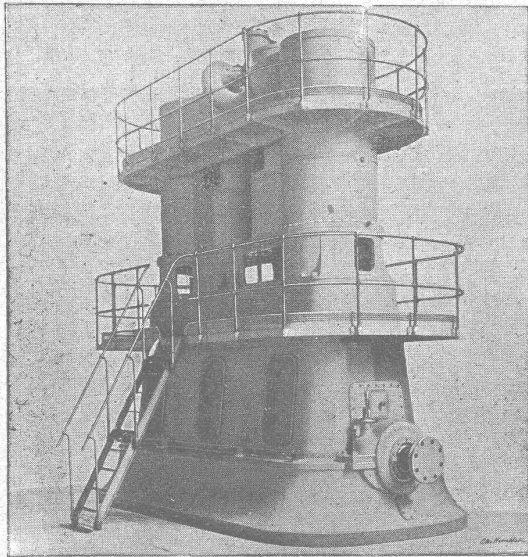
Machine à triple expansion ayant fonctionné à l'Exposition de 1900. (Galerie des Groupes électrogènes).

Puissance : 1200 chevaux env. - Nombre de tours par minute : 250.