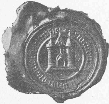
Fig. 2. — Sceau du XVII e siècle. (Propriété de M. Romy, instituteur, à Moutier).

Un autre sceau de la prévôté est identique au premier, à part quelques détails de peu d'importance, caractéristiques de l'art au XVII e siècle. L'exécution en est plus soignée et il porte sous le socle profilé la date 16 + 91. (Grâce à l'obligeance de M. Romy, instituteur à Moutier, nous pouvons le reproduire, fig. 2).