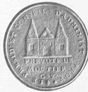
Fig. 3. — Sceau du XVIII e siècle. (Propriété de M. Romy, instituteur, à Moutier).

Les armes de Moutier qui figurent sur la bannière et le sceau de 1793, ainsi que celles qui sont sur le tableau des 30 districts bernois sont, en termes héraldiques, des armoiries diffamées ! N'oublions pas que c'est au XV e siècle que la science et l'art héraldique ont acquis leurs règles précises, dictées par les héraults d'armes. Au XVI e siècle la plupart des cités adoptèrent des armoiries régulières, conservées jusqu'au milieu du XVIII e siècle. Donc, il n'y a plus aucun doute, le véritable blason de Moutier est de fond gueule, monastère argent, comme le prouve le sceau du XV e siècle et que le confirme celui du XVII e siècle, qui sont les principaux monuments vivants des armoiries de l'ancienne prévôté (fig. 4).