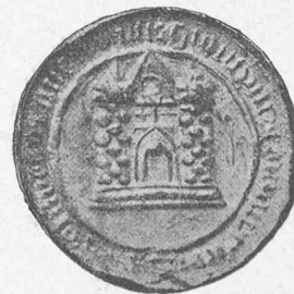
Fig. 1. — Sceau du XV e siècle. (Propriété de M. Cattat).

En 1446, le prévôt octroie le « rôle ». Le 14 mai 1486, la prévôté conclut un traité de combourgeoisie avec Berne. L'historien Quiquerez nous dit que, vers la fin du XV e siècle, la prévôté avait son sceau et sa bannière, malheureusement, il n'y a que le premier que l'on retrouve encore.