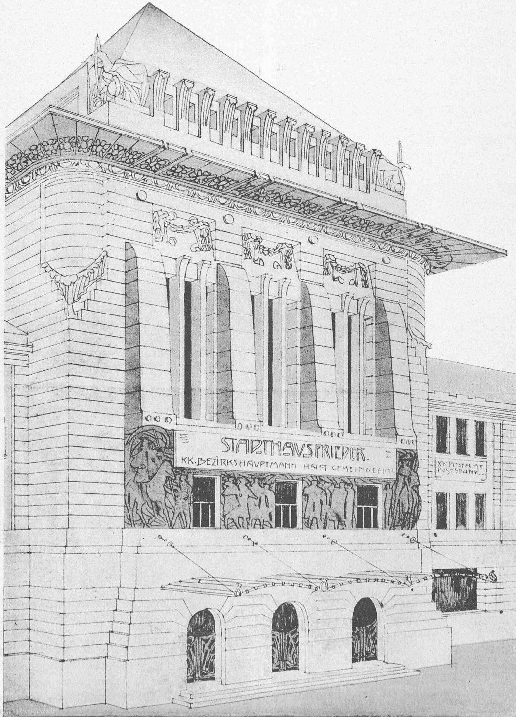
Fig. 1. — Concours pour l'Hôtel-de-Ville de Friedek. — Projet de MM. Léopold Bauer et R. Melichar, architectes, à Vienne. D'après « Architektonische Monatshefte ». — J. Engelhorn, éditeur, Stuttgart.