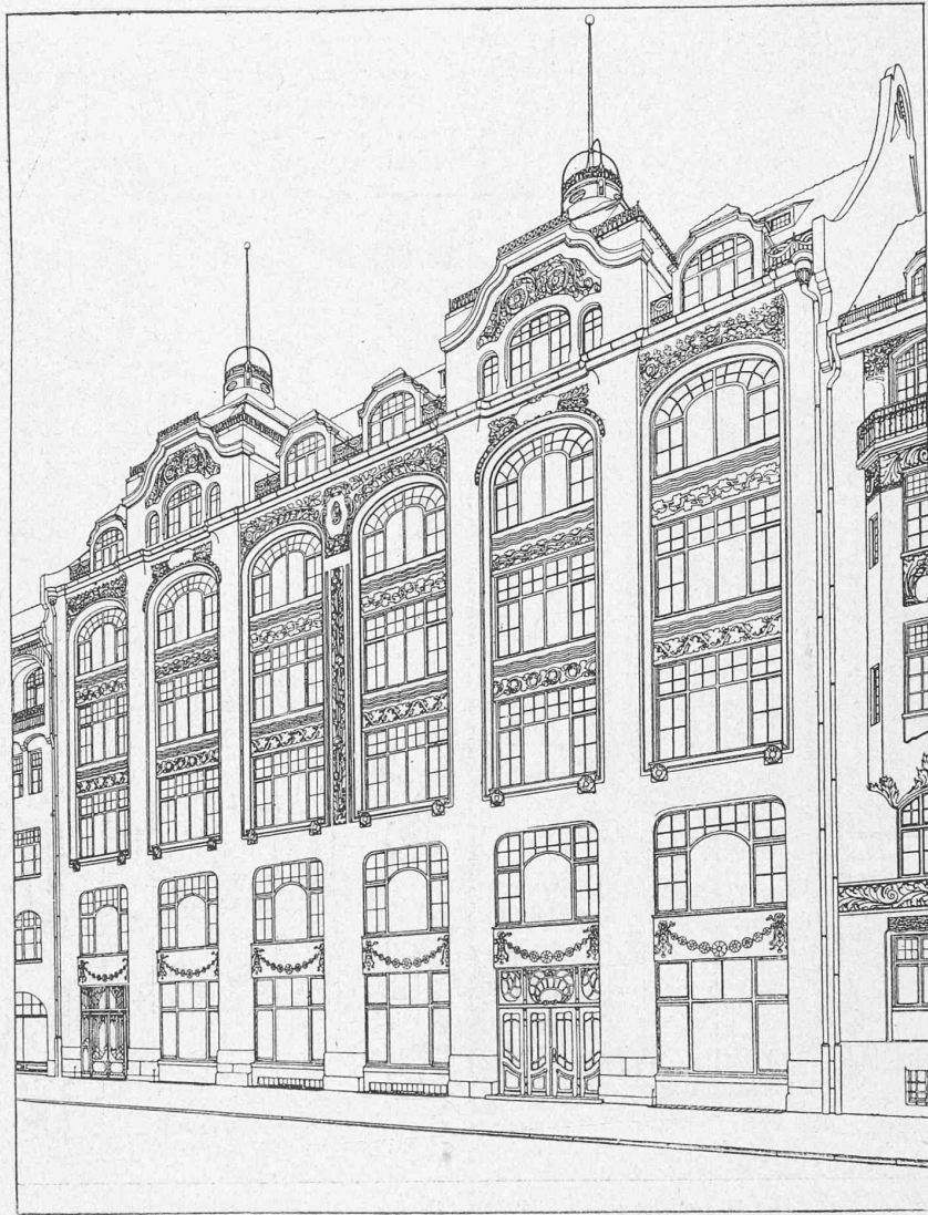
Fig. 22. — Magasins H. et J. Gutmann, Schwanthalerstrasse, à Munich. Architectes : MM. Höning et Söldner.