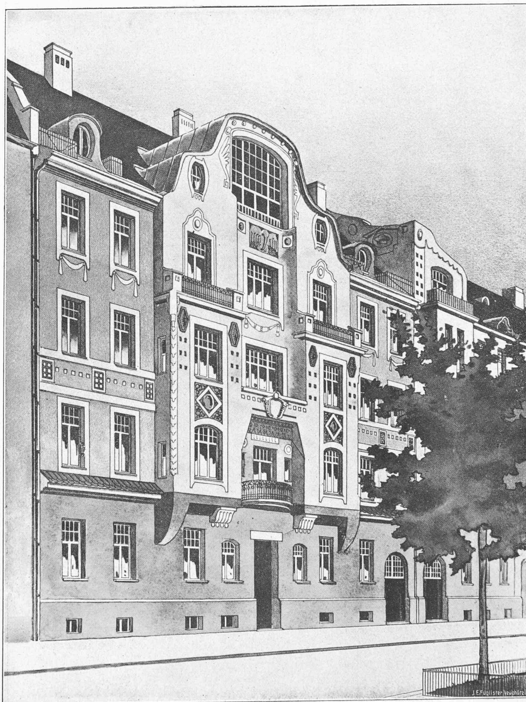
D'après « Moderne Baukunst ». Konrad Wittwer, édit., Stuttgart.