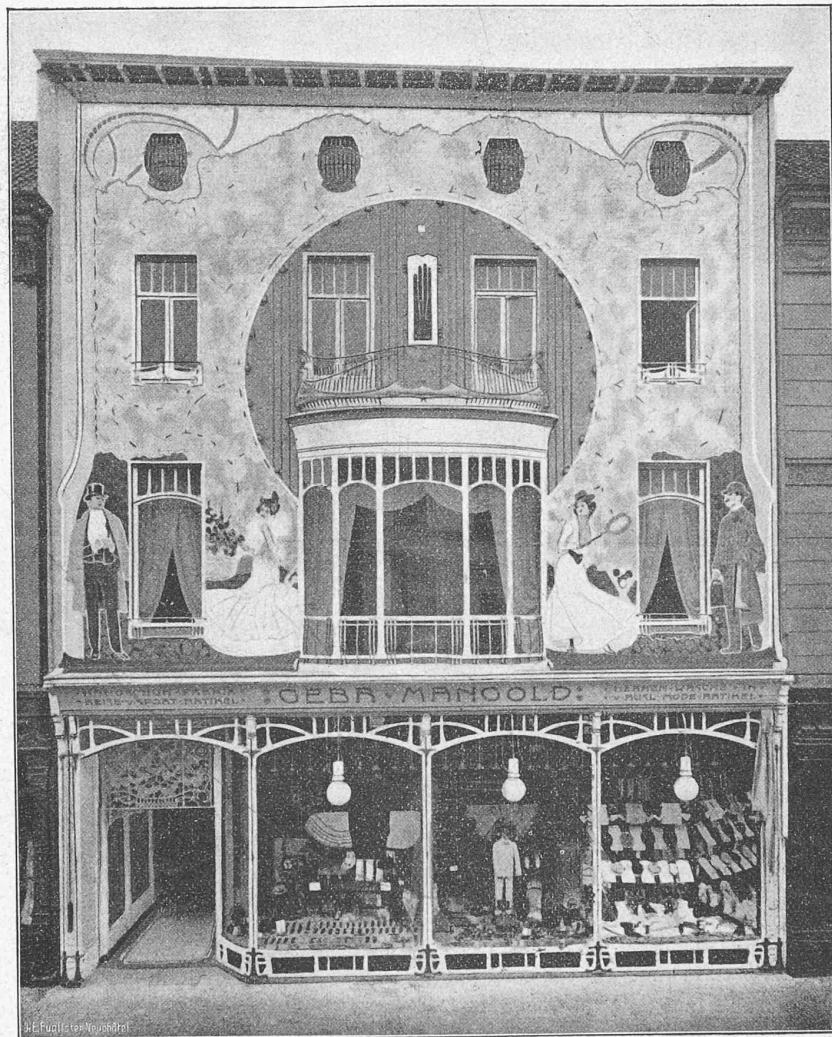
Fig. 20. — Maison de commerce et magasins à Dusseldorf. Architectes : MM. Wehling et Ludwig.