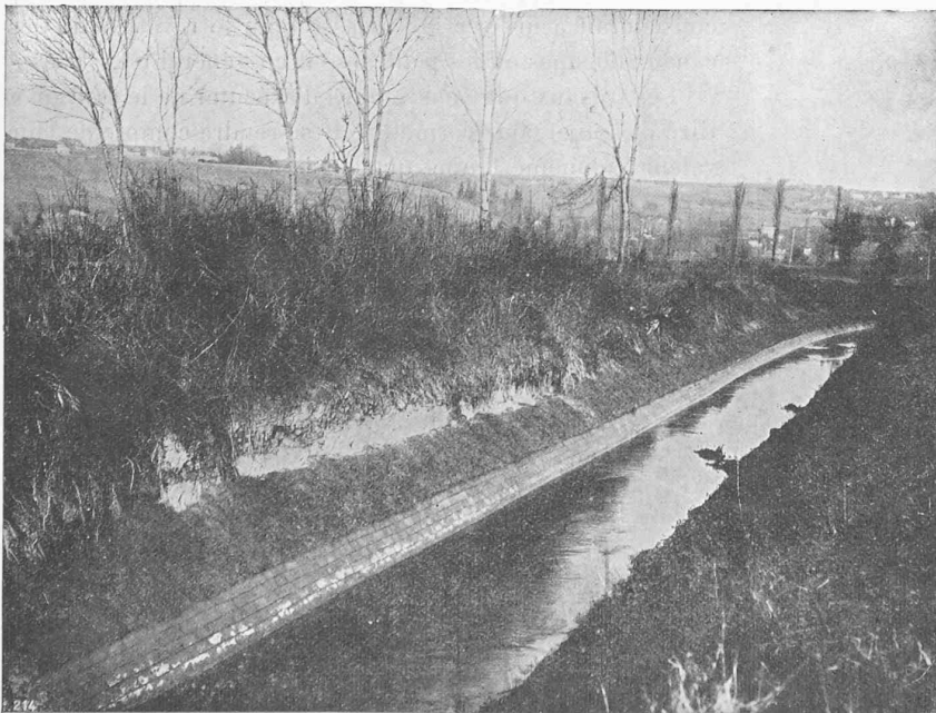
Fig. 8. — Protection exécutée au Fossé-Neuf, à Salavaux.